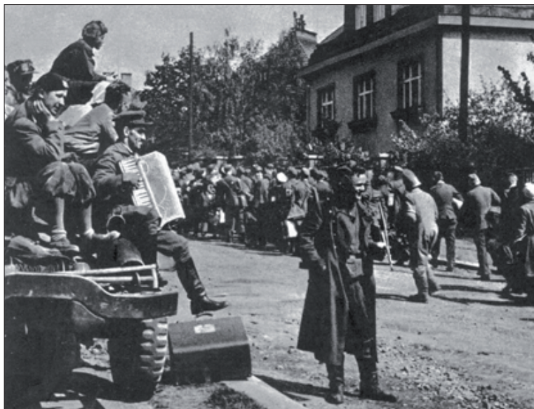
Praha v květnu 1945

mužů, bratrů a synů, kteří byli takto zákeřně uneseni, zoufale pobíhaly po celé Praze v naději, že naleznou své blízké, a posléze vyčerpané marným pátráním a nejistotou upadaly do hluboké deprese.