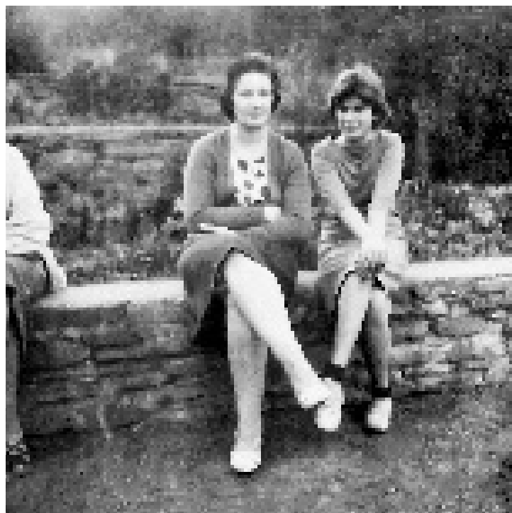
S maminkou v parku Julia Fučíka