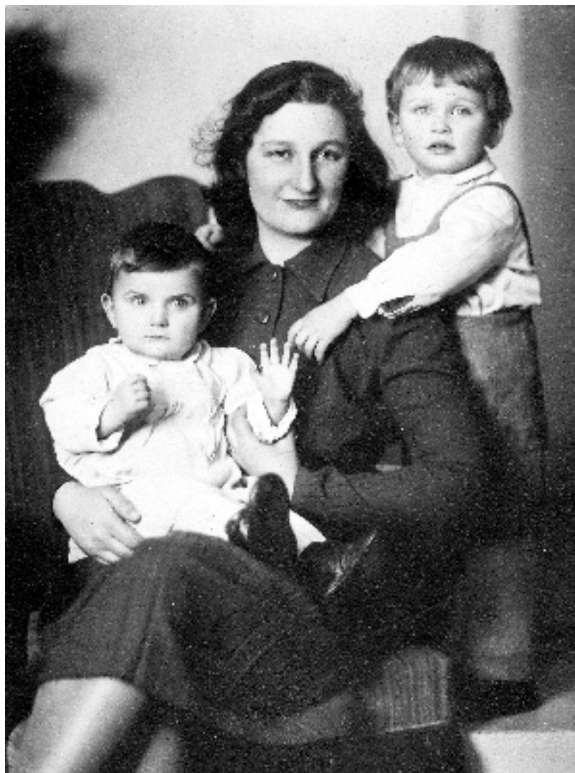
S maminkou a s Kájou