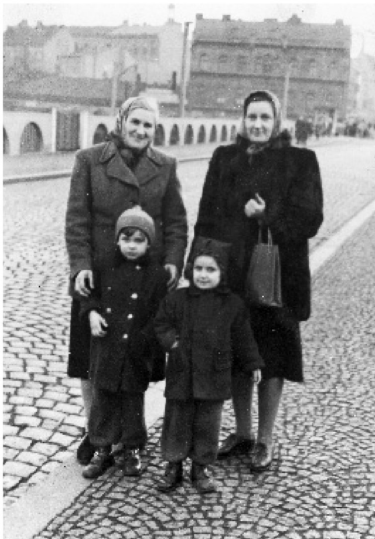
S babičkou, s maminkou a s Kájou, na kolínském mostě