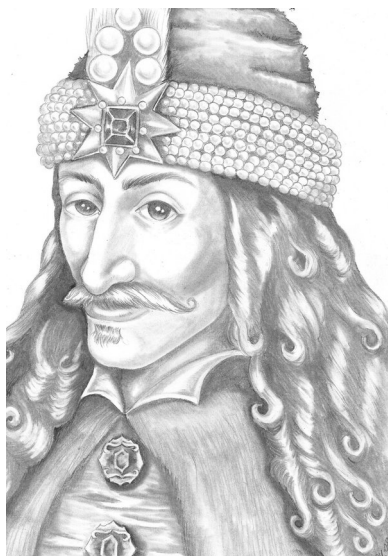
Vlad III. Țepeș

Přestože v Rumunsku byla víra v upíry velice rozšířená a částečně přetrvává dodnes, slovo vampír tu bylo až donedávna takřka neznámé, neboť pro tento druh bytostí se používalo označení latinské nebo slovanské, avšak ve variantě „vlkodlak“.