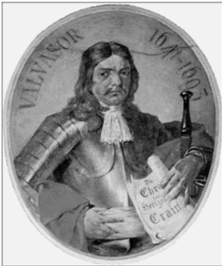
Johan Weichart Valvasor