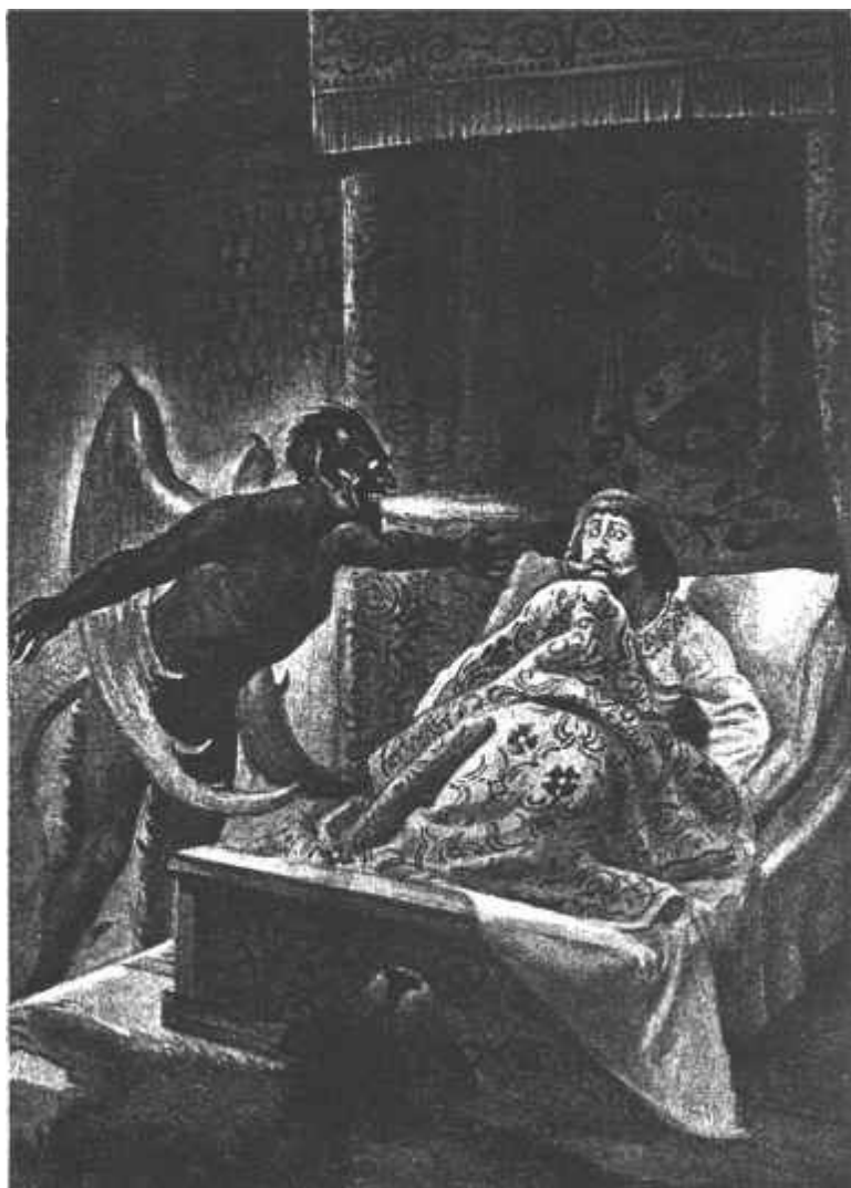
Ložnice páně Půtova zaplála ohněm, v němž objevila se chechtavá tvář čertova.

Byla bouřná, divá noc. Na nebi nebylo zřítí ani jediné hvězdy, ani mihotavého, bloudivého záblesku.