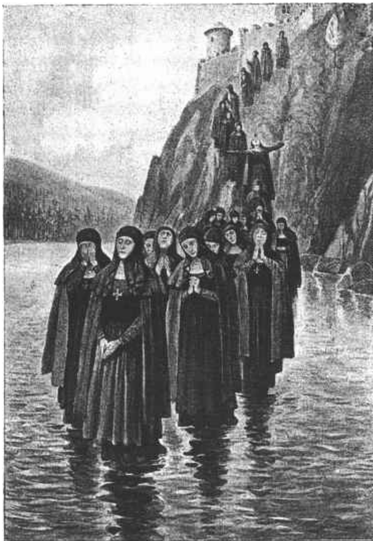
Průvod kvílících jeptišek po hradní skále k řece Lužnici.

Nejbližší neděli, mnohem dříve než sezváněno bylo na „malou“, blížili se malšičtí chasníci k temným stínům Příběnických zádumčivých hvozďů.