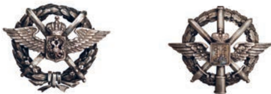
Obr. 9, 10