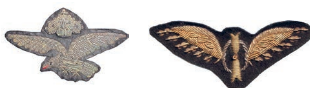
Obr. 5, 6

Nášivky italského pilota a pozorovatele z I. světové války.