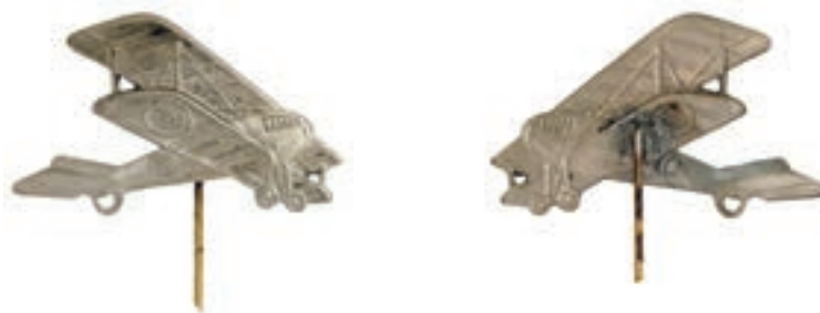
Obr. 16, 17