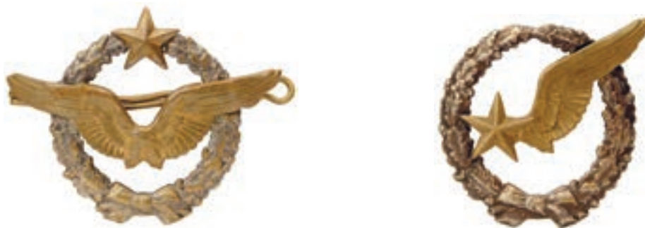
Obr. 3, 4

Po vzniku zahraničních vojenských jednotek, vytvořených z přeběhlíků a Čechů žijících v cizině, se někteří jednotlivci hlásili k letectvu, a to nejprve ve Francii a později i v Itálii, několik Čechů sloužilo v první světové válce i v letectvu USA. V žádném z těchto dohodových států však nedošlo k vytvoření ryze národní letecké jednotky, jako tomu bylo u pozemního vojska. Českoslovenští letci ani neměli žádný zvláštní odznak a svou kvalifikaci prokazovali pilotními či jinými odznaky toho kterého státu, jehož uniformu nosili.