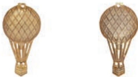
Obr. 14, 15