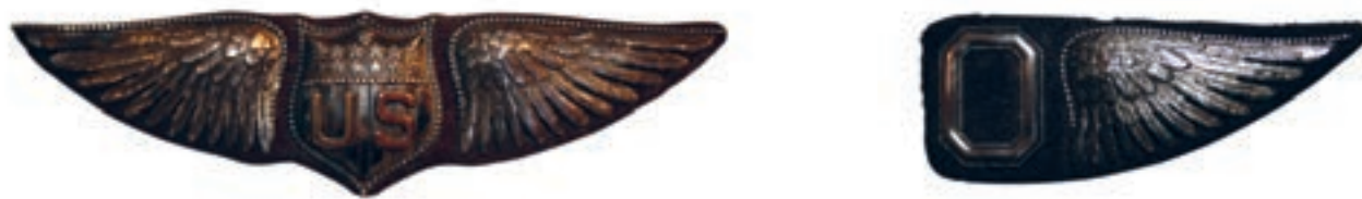
Obr. 7, 8

Odznaky pilota a pozorovatele letectva USA z I. světové války.