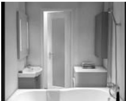
Obr. 2 Tigo koupelna