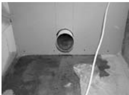
Obr. 4 Sádrokartonová příčka na WC