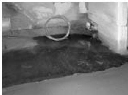
Obr. 6 Příčka z pórobetonu

+ každou druhou ložnou spáru pruhem z perlinkové tkaniny. Ke stávajícím betonovým svislým panelům přikotvíme nové části pomocí ocelového pásku uchyceného do panelu ocelovou nebo chemickou kotvou. Horní část nové konstrukce ukončíme pod stropním panelem a vzniklou spáru vyplníme pružnou stavební polyuretanovou pěnou. Tou doplníme i svislé napojení ke stávajícím částem konstrukce. Do příček vkládáme bez dalších úprav zárubně. Nové stěny doplníme stavební přípravou pro elektroinstalace, rozvody vody a odpady. Pro jednotlivé sítě budou připraveny předvrtané otvory nebo vytvořeny drážky.