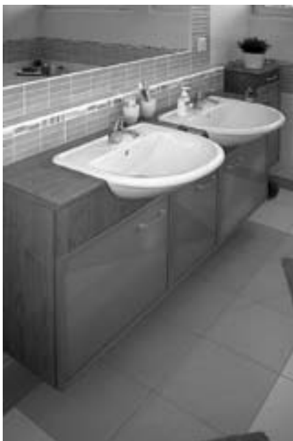
Obr. 8 Keramické obklady s listelami

bude svislé napojení sprchových stěn na obklad. Také bychom měli mít povědomí o působení formátu obkladu – jakým způsobem bude náš řešený prostor vypadat s obklady čtvercovými, obdélníky nastojato či obdélníky naležato. Řešení prostoru je nutno vnímat i přes velikost zvolených formátů obkladů a dlažby. V neposlední řadě je vhodné se zamyslet nad vazbou obkladů a dlažby. Zbytečně malé plochy obkladů na kráse naší vysněné koupelně nepřidají. Je dobré počítat s nároky na provoz (ochota plochy umývat), množství spár náchylných na plesnivění, ač již existuje množství prostředků proti nim. Důležitá je při výběru materiálu informace o tvrdosti vody. Usazování vodního kamene na světlých plochách bude vypadat jinak než na plochách tmavých. V tuto chvíli bychom měli také vědět, co vše umí vybraný druh materiálu se zasychající vodou. Vždy je třeba provést technologii předepsané hydroizolační nátěry. Spáry jsou řešeny v trvale pružných materiálech v široké škále barev. Většinu obkladů lze použít i pro podlahu – jako dlažbu.