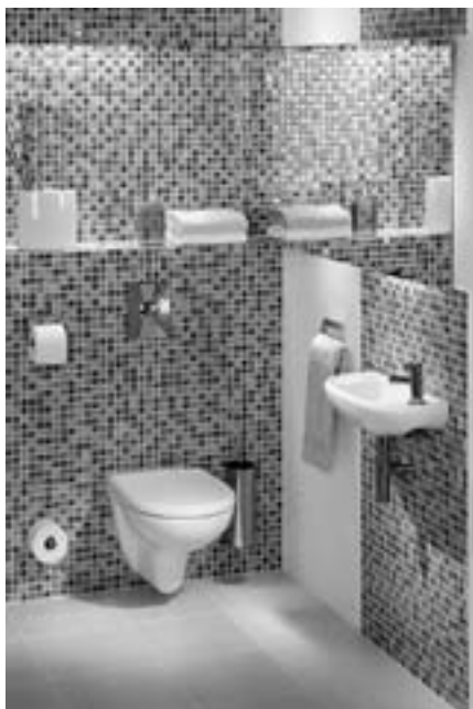
Obr. 7 Obklady z drobných keramických kachliček – mozaiky