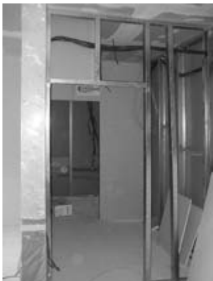
Obr. 5 Konstrukce pro upevnění sádrokartonu

V panelové stavbě se věnujeme v rámci budování nových konstrukcí podrobně i zvukové izolaci. Konstrukce se doplní vnitřní vrstvou minerální vaty. Důsledně se provede rovněž styk s jinými materiály v úrovni stropu, stěn i podlahy. Pod nové konstrukce se ukládá přípojovací těsnění. Použití parozábrany v interiéru není běžné. Každopádně bude osazeno odvětrání místnosti.