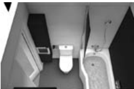
Obr. 1 Sestava Tigo vhodná do koupelen v panelových domech

Každá rekonstrukce vyžaduje velmi dobrou přípravu a je třeba hned od počátku si ujasnit, co od budoucí koupelny očekáváme a jaké funkce bude v obytném prostoru plnit. Podle rozsahu přestavby a potřebných stavebních úprav může jít o práce udržovacího charakteru, které nevyžadují ani ohlášení stavebnímu úřadu (výměna zařizovacích