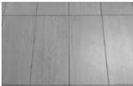
Obr. 9 Dlažba keramická velkoplošná

Dlažby jsou klasickým řešením podlahy v bytovém jádru. Použity bývají keramické dlaždice. Dnešní dlažba je doplněním obkladu, často lze přímo použít stejný materiál.