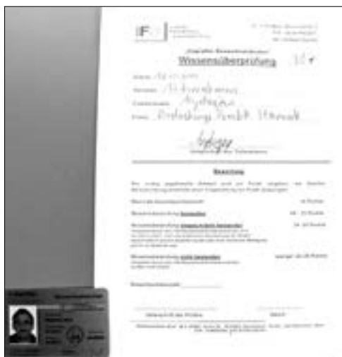
Obr. 1.001 Příklad zkušební formuláře a legitimace izolačera

Opět příklad ze života. Významný český generální dodavatel realizoval střešní plášť s obdobnou garážovou firmou, i když ve formě 200tisícového „eseróčka“. Tato firma rychle po realizaci zanikla a reinkarovala se pod jiným názvem. S předmětným střešním pláštěm byly dlouhodobé potíže, velmi časté reklamace, až po určité době zkolaboval hydroizolační materiál. Protože materiál dodávala ona garážová, již neexistující firma, musel celou rekonstrukci generální dodavatel provést na vlastní náklady. Celková cena rekonstrukce se vyšplhala na trojnásobek ceny původního střešního pláště. Nevím, jak dalece si generální dodavatelé uvědomují právní důsledky likvidace subdodavatele, ale čas od času k tomu dochází, a pak jsou samozřejmě záruky za stavební dílo nebo jeho část prakticky nevymahatelné.