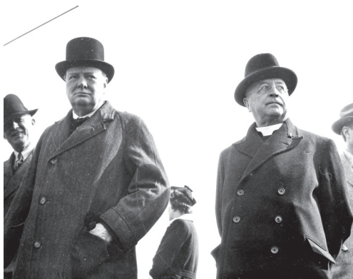
Msgre Jan Šrámek spolu s Winstonem Churchillem na pozdějším snímku z doby svého působení ve funkci předsedy čs. exilové vlády

Přímo pro české podmínky vydal Lev XIII. také velmi stručnou encykliku Quae ad nos , publikovanou v listopadu 1902, kde varoval před rychlým šířením sekularizačních myšlenek v českém i moravském prostředí. Z tohoto důvodu vyzýval k lepší komunikaci mezi biskupy v Čechách a na Moravě, aby si tak mohli předávat potřebné zkušenosti, kterých by využili v obhajobě věroučných zásad.