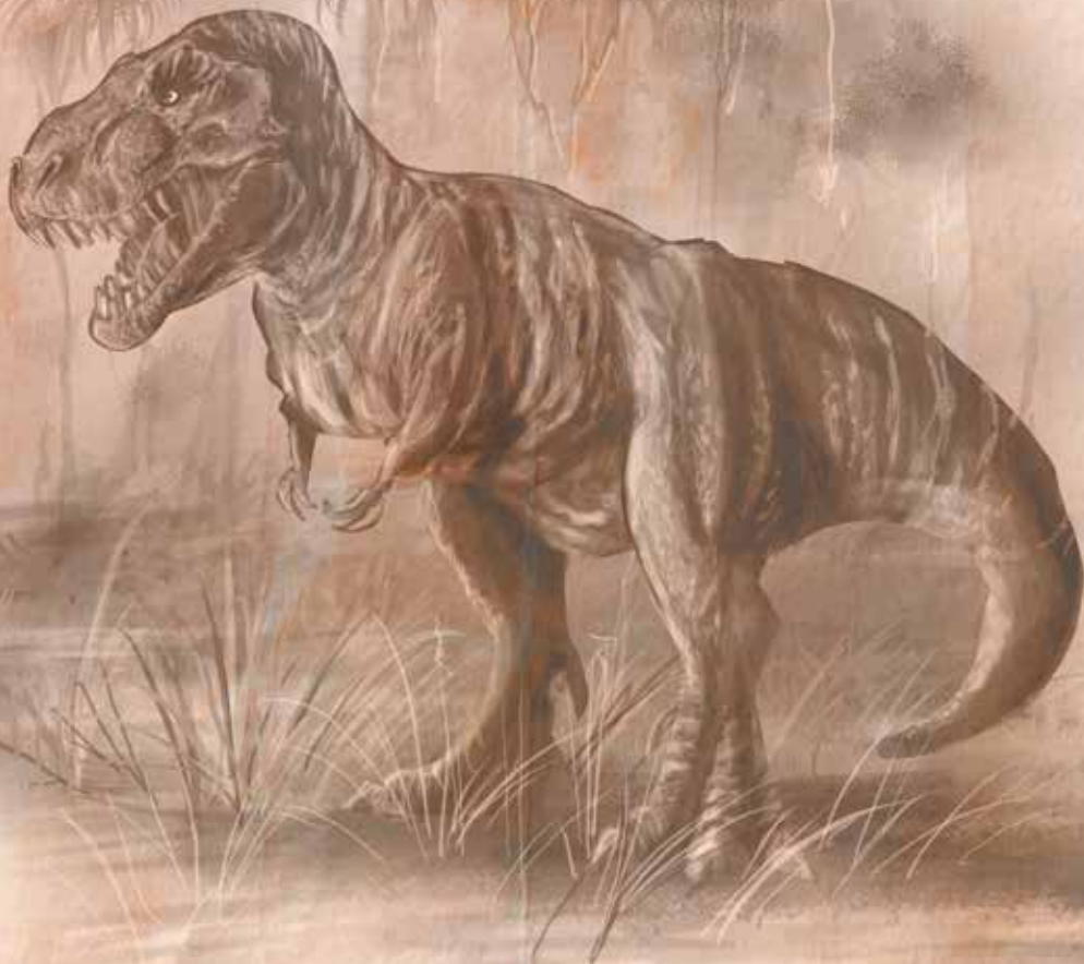
Tyrannosaurus rex (vládce ještěrů)

Dosahoval velikosti až 13 metrů a vyskytoval se v období křídly hlavně na dnešním území Spojených států amerických. Vědci se dosud nemohou shodnout, zda byl aktivně lovcí dravec, či pouhý mrchožrout. Faktem ale zůstává, že je tento ještěr jedním z největších a nejnebezpečnějších masožravců, jaký kdy chodil po naší planetě.