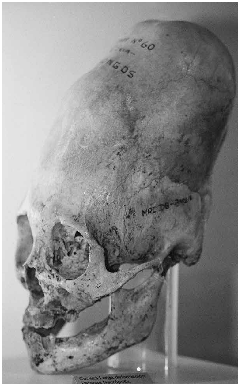
Cabeza Larga, deformación Paracas Necrópolis.