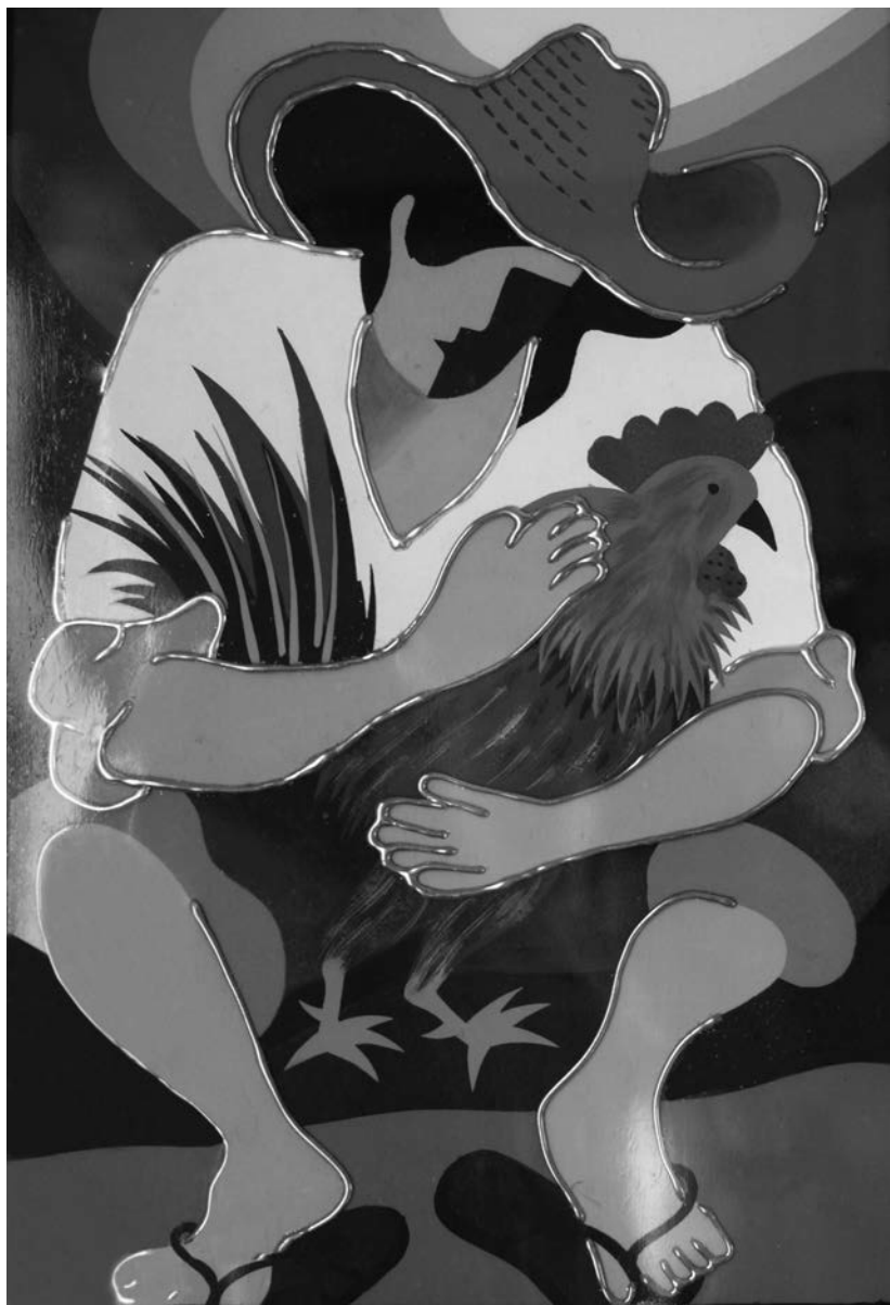
Nejvěrnější přítel Filipínce