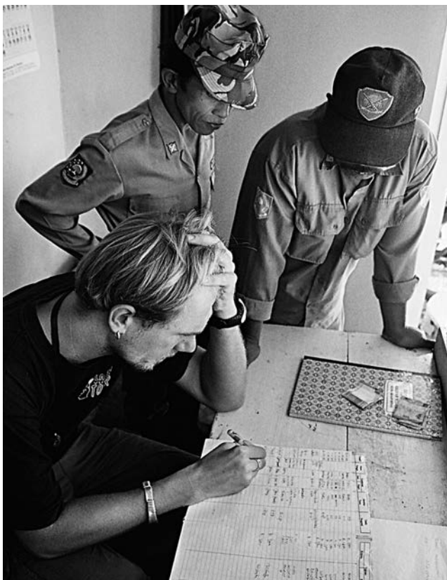
Byrokracie vládne i tady...