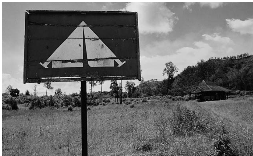
Kemp na zdejší způsob

Dodávka se konečně vyhoupne z poslední hrbolaté zatáčky a snad jako za odměnu vás ze všech stran, skoro naráz, obklopí kávové plantáže. Překvapení je to vskutku nečekané a hlavně – dokonalé! Pos Palangan je provizorní stanoviště, které slouží k základní kontrole pohybu ve zdejší lokalitě. Pár dřevěných domků s uniformovanými strážci, prodejna benzínu načepovaného do lahví od všeho možného a místo speciální prémie – skvostný výhled na zčásti zalesněný horský masiv.