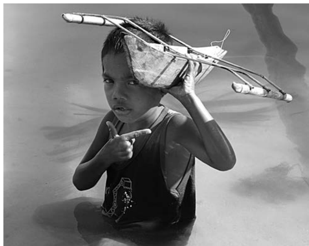
Hračky věrně imitující realitu

centrem potápěčů, takže hned nazítří najímáme člun a vyrážíme na průzkum okolí. Lagun s malými plážemi je tu nepočítaně, stačí půlhodina jízdy a už šnorchlujeme v průzračném tropickém moři. Během dalších dnů postupně objíždíme a mapujeme velkou část souostroví Bacuit, obklopující zátoku El Nido. Kam oko pohlédne, vystupují nad hladinu rozervané vápencové útvary, které díky erozi působí jako kulisy z fantastických pohádek, či zkamenělé plachty přízračných plavidel. Nešidíme ovšem ani večerní program – jídlo, pivo i džusy jsou tu na jedničku, snad jen návštěvníci několika internetových kaváren tu opravdu trpí, to díky častému vypínání elektrického proudu. Pro tuhle situaci tady existuje i speciální termín – brownouts. Ještě poslední lodní výlet včetně letmé návštěvy kapličky, stojící na korálovém ostrůvku, ne větším, nežli můj obývací, nezbytné balení... a pak už jen únavná štreka busem, přes Taytay a Roxas do Puerto Princesa. Noc a den, které zbývají před odletem zpět na Luzon, trávím couráním po městě a protože spím v hostelu poblíž rybářské čtvrti, snažím se vychutnat zdejší atmosféru, jak jen to jde. Po dlouhých molech nad vodou, splujících uličky,