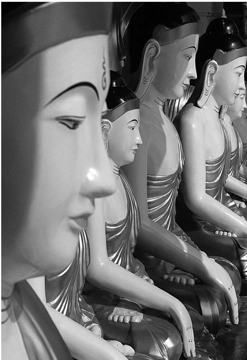
„Buddhovník“ (Yangon, Barma)