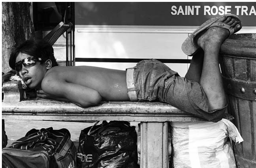
Po těžké noci...

Jakýmsi nekončícím očištěm a zároveň i kazem na krásu filipínského ráje jsou, krom nedobrého stavu hospodářství a miliónů lidí žijících hluboko pod hranicí chudoby, i stále se