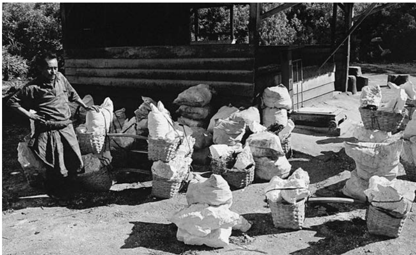
Výsledek celodenní práce

V Pal Tuding je něco jako tábořiště, které se rozkládá hned vedle kanceláře Národního parku. Jde vlastně o zanedbanou louku, řídce obestavenou pár dřevěnými baráky. Možnost placeného ubytování „pod střechou“ je prozřetelnější striktně odmítnout, přítomnost štěrnic a jim podobné havěti je totiž zřejmá už na první pohled. Jako často předtím (a potom) platí, že není nad vlastní spacák. Snad jedinou trochu použitelnou záležitostí tak zůstává místní bistýrko, lépe řečeno jídelna s honosným názvem Café Edelwys. Nějaké ty nápoje a teplá polévka – dost chudá nabídka, v tomhle zapadlém koutě je to ale víc, než si lze vůbec přát.