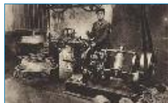
Výroba drátů z počátku 20. stol.

Rozvoj drátenictví byl umožněn i snadnou dostupností potřebného materiálu. V sousedním Slezsku existovala od 16. století rozvinutá železářská výroba (hamry, později hutě), od 18. století fungovaly ve Slezsku drátovny a sklady drátů. Ani doprava nebyla problémem, protože do Slezska nebylo daleko a navíc přes Žilinu jezdili pravidelně formani s nákladem zboží do Bratislavy a do Vídně. Drátenická technika byla ve své podstatě jednodu-