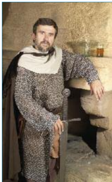
Oděv středověkého rytíře (rekonstrukce Three Brothers Production)

Postup zhotovení drátěných košil spočíval ve vzájemném navazování kovových kroužků a jejich spojování nýtky. Kroužky přitom zůstávaly volné, takže oděnění bylo elastické a neomezovalo vojáka v pohybu. Původně