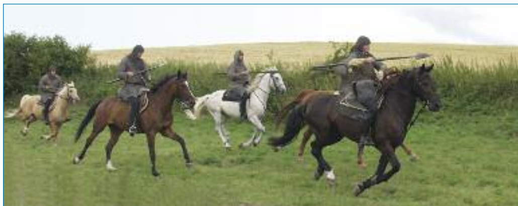
Jezdci v dobové zbroji (rekonstrukce Three Brothers Production)