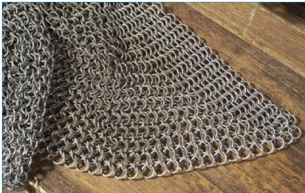
Drátěná košile (rekonstrukce Three Brothers Production)

Je zajímavé, že již v pravěku se drát užíval také k opravám hliněných nádob. Původně si lidé prasklé hrnce stahovali pomocí konopného provazu, s rozšířením výroby kovového drátu si však kdosi všiml, že jeho užití pro tento účel je výhodnější, neboť je trvanlivější, není pružný a ve vlhku se neuvolňuje. A tak se začaly železné dráty už v keltském prostředí (cca 5. – 4. stol. př. n. l.) užívat místo provazů k jednoduchému stažení prasklé keramiky, zvanému heftování. Na protilehlých stranách praskliny se vyvrtaly dírky, jimiž se provlékl drát a pevně se stáhl. Zajímavá kolekce střepů misek a hrnců s navrtanými otvory (v jednom se dokonce dochoval kousek železného drátu) byla objevena roku 1973 při výzkumu keltské osady Chýnov (dnes součást středočeských Libčic nad Vltavou severně od Prahy).