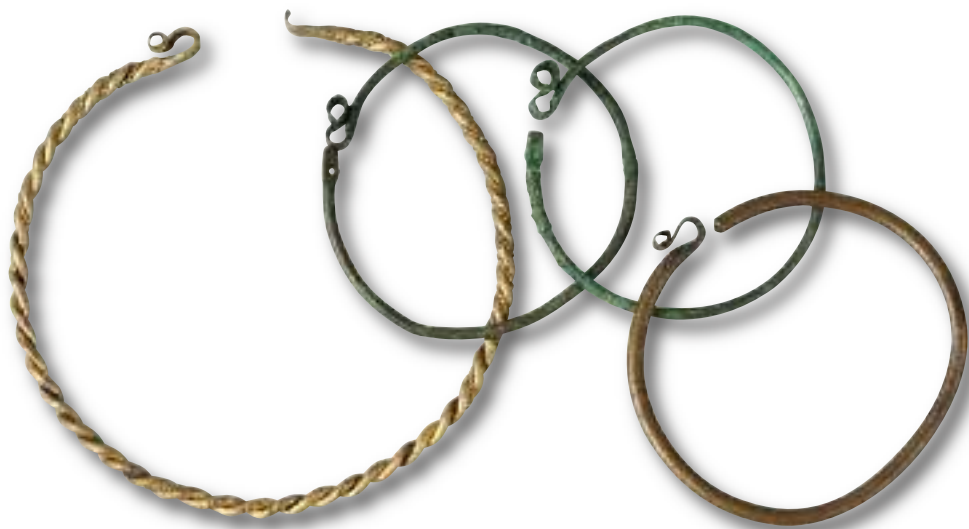
Záušnice (muzeum Brandýs n. Labem)

S rozvojem středověkých řemesel se železný drát začal ve větší míře uplatňovat ve městech i na venkově jako materiál pro zhotovování jednoduchých pomůcek pro domácnost a hospodářství nebo částí zemědělského nářadí. Používal se ovšem výhradně tam, kde se nedal nahradit levnějšími materiály, jako lýko, loubek, dřevo apod. Kovové výrobky byly drahé a až do třicetileté války se považovaly spíše za luxus. Nicméně už před husitskými válkami se dráty objevují při vázání žebřin vozů, spojování klečí pluhů, jako ucha vědýrek apod. Oblíbené byly také k ovíjení střenek nožů a rukojetí dýk a mečů.