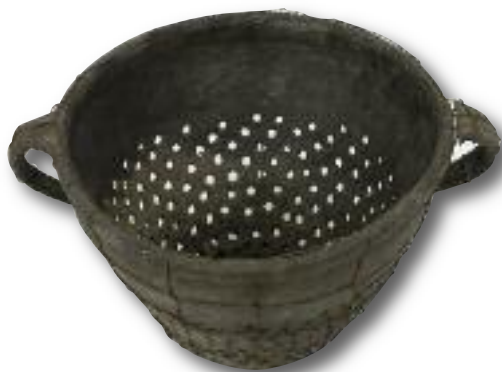
Cedník na povidla, počátek 20. stol. (Muzeum romské kultury)

což je na svou dobu ohromující číslo. Dráteník se pro středoevropské země stal dokonce synonymem pro obyvatele Horních Uher – Slováků.