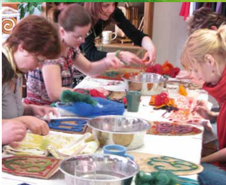
Z kurzu plstění

Plstěné koberce jsou plné vzorů, vytvářejí se z barvené ovčí vlny, většinou je to ženská práce. Zajímavé by bylo zabývat se i symbolikou pradávných vzorů, tvary i barvy v kobercích nejsou náhodou, ukrývají v sobě víc, než můžeme pouhým okem odhalit. Nejen zvláštní harmonii v pravidelnosti, ale i hlubší význam jednoduchých forem můžeme cítit, postupným bádáním i objevovat. Velkou předností vzorů je jednoduchost a zřetelnost. Pokusíme se