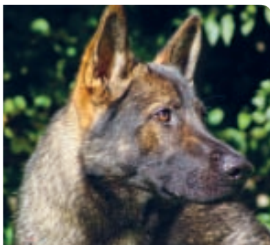
Služební nos: jeho příbuzní často čenichají ve službách policie – Quinn.

mohou zpracovávat pachové látky rozpuštěné v tekutině.