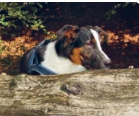
Tohle Bossi uklidní: hledání jídla s nasazením vlastního nosu.

Už vám svitlo? Patří k nim – hry, při kterých musí zapojit čenich!