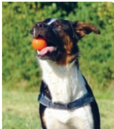
Zaměstnání, které aktivizuje: hra s míčkem Bossi rozparádí.

Napadlo by vás to? Různé druhy zaměstnání mohou působit zcela rozdílně – a ne všechny způsobí, že náš rodinný pes bude klidný a vyořvaný. Možná znáte nějakého