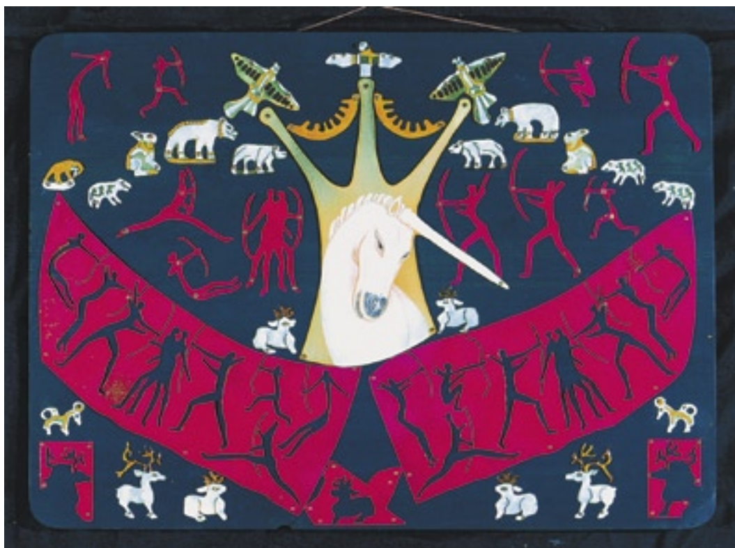
Szvetlána Tóth (Rusko), Lov na jednorožce, měď, smalt, dřevo, 45 × 65 cm

Každý má ke smaltu jiný přístup, někdo si vše pečlivě plánuje, zapisuje, studuje dostupné návody a knihy, někdo naopak impulzivně zkouší u pece a hledá bez pravidel a návodů. Mně je bližší spíše druhý přístup. Přesto mi dlouhá léta souhrnná publikace o smaltu u nás chyběla. K napsání této knihy jsem se rozhodla po dvaceti letech praxe bez četby návodů, přesto doufám, že poznatky uvedené v této publikaci mohou někomu dalšímu jeho cestu usnadnit.