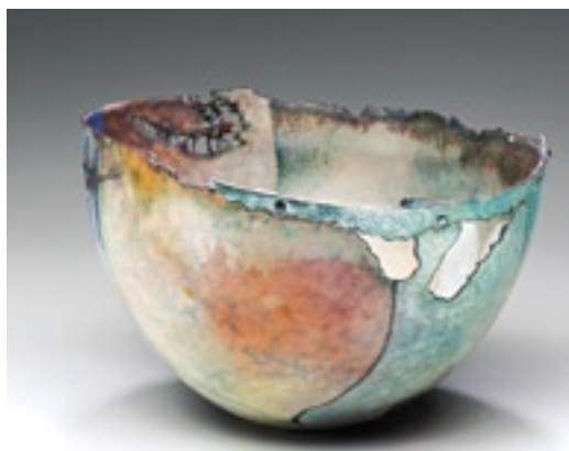
Judy Stone (USA), nádoba, měď, smalt