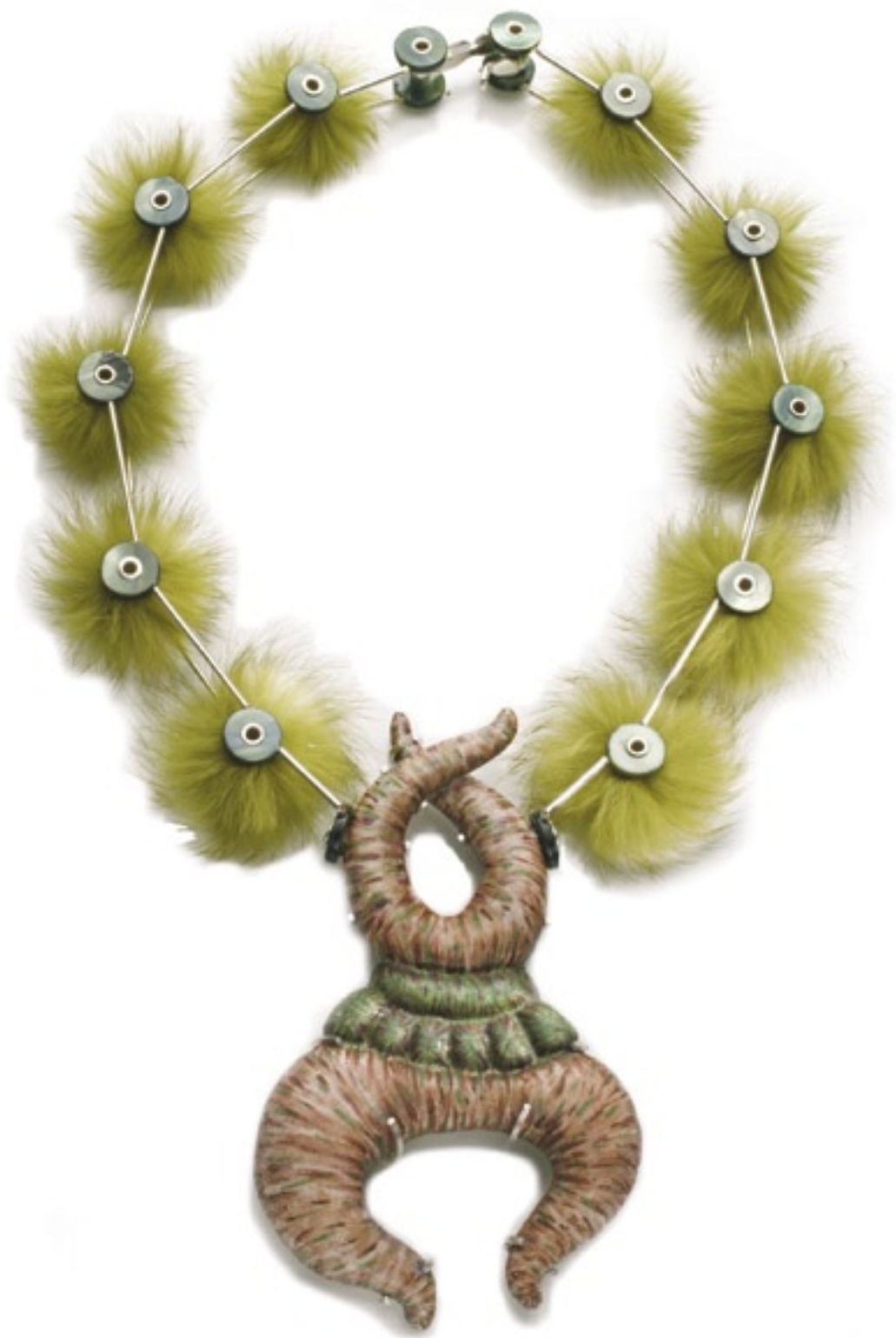
Shana Kroiz (USA), Královská tanečnice, stříbro 925/1000, perleť, kožešina, smalt na mědi, galvanoplastika