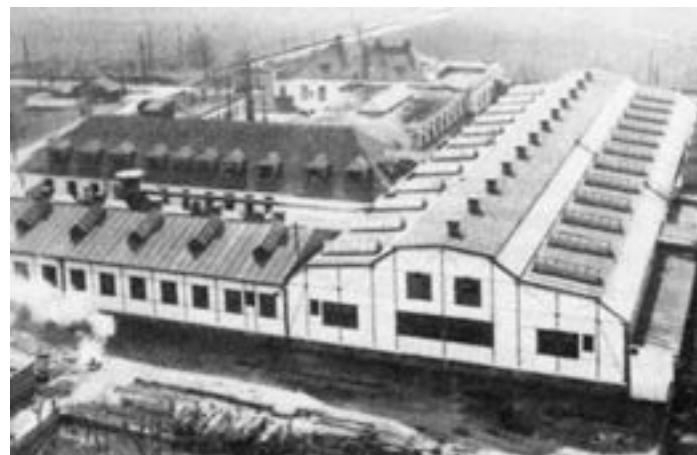
► Objekty Janečkovy zbrojovky Na Zelené lišce

Zanedlouho mohlo stěhování výroby z Mnichova Hradiště do Prahy začít. Strojní výroba se přesunula a společně se zbrojním arsenálem stoupal i počet dalších Janečkových