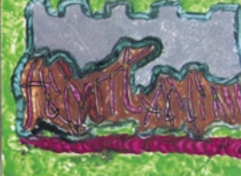
227. Zlata pergamenová naleziště tabulka z doby před našim 2p.