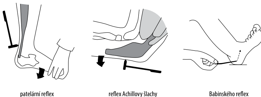
Obr. 2 Technika vybavování svalových reflexů na dolních končetinách