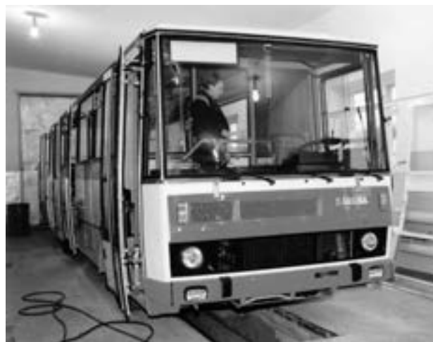
Autobusy Karosa B 732 se montovaly od roku 1997 z dovezených dílů i v dalekém Tatarstánu