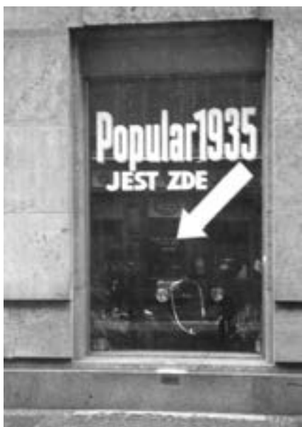
Do roku 1935 vjel popular se zaoblenější karoserií, zdokonaleným motorem i bohatší výbavou