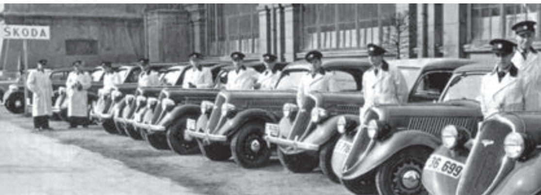
Tovární řidiči připravení předvést návštěvníkům pražského autosalonu v roce 1936 nové provedení popularu