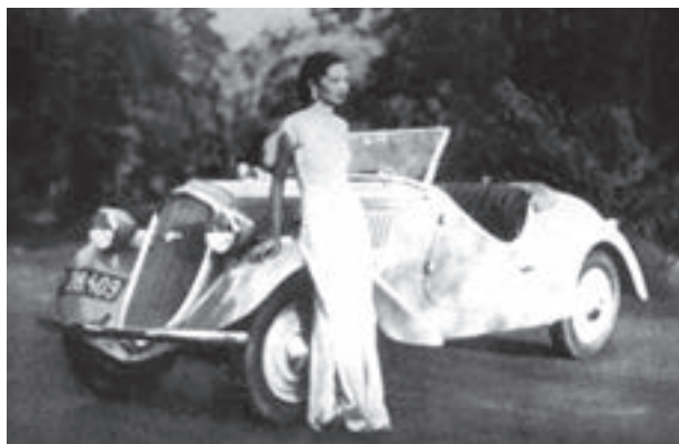
„Elegantní dvojice indicko-československá. Je to mondénní Indka ze Singapuru a čs. vůz Škoda-Popular“ (1935)

K prestižním zákazníkům patřil teprve patnáctiletý jugoslávský král Petar II., který si užíval luxusní roadster s radiopřijímačem a koženým čalouněním.