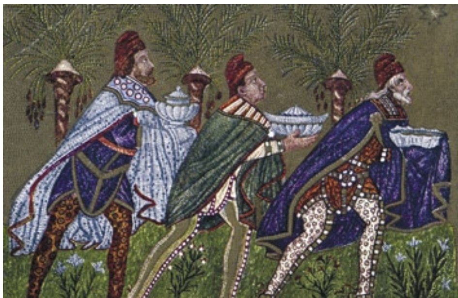
Klanění tří králů, Ravenna San Apollinare Nuovo 6. st