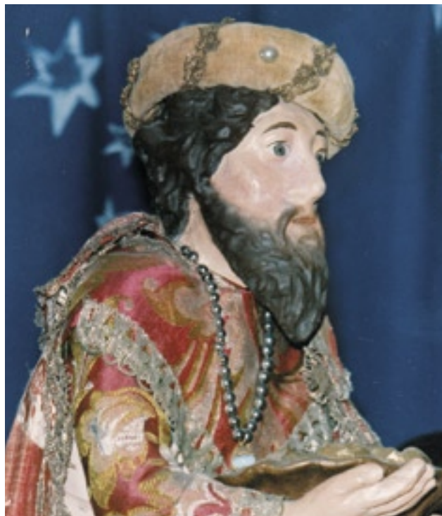
Oblékaná figura krále, muzeum Netolice, foto J. Roda

Nepočetná je i řada deskových malovaných betlémů, z nich nejstarší je z Nového Bydžova, datovaný už do poloviny 17. století. Deskové betlémy malované na dřevě nebo lepence do oblby uvedly řády františkánů a kapucínů [4].