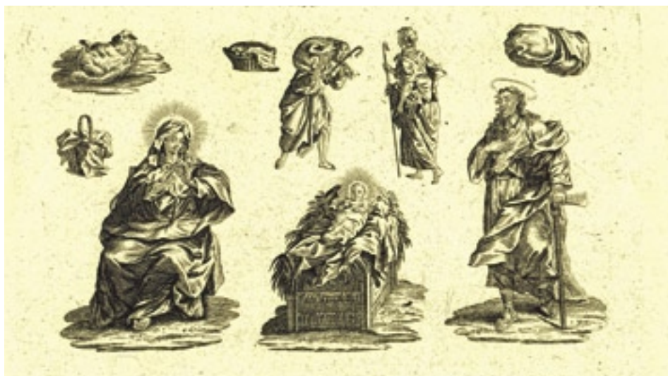
Nejstarší český tištěný arch z grafické sbírky premonstrátů na Strahově, tisk firma Balzer

Doznívání zákazu vystavování betlémů v kostelích trvalo podle důkladnosti jeho dodržování v různých regionech asi do roku 1825. Betlémy se vracejí do kostelů, ale také už trvale zůstávají v domácnostech měšťanů i prostého lidu.