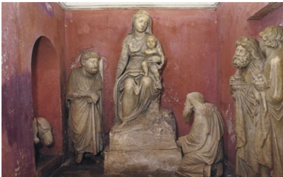
Arnolfo di Cambio: Klanění Tří králů , Řím 1288

Nejstarší známé sochařské zpracování Klanění Tří králů pro baziliku Santa Maria Maggiore vytvořil v roce 1288 italský sochař a architekt Arnolfo di Cambio (1245–1302). Postavy Tří králů, sv. Josefa hlavy osla a vola spolu s pozdější kopíí sedící P. Marie s Ježíškem v náručí se v kostele o Vánocích dodnes vystavují, i když jsou pochybnosti, zda jde o původní soubor.