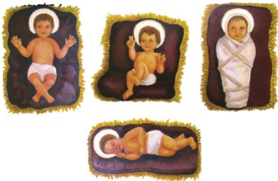
Obvyklé pozice Jezulátka

Internetové zdroje – Google a Wikipedie.