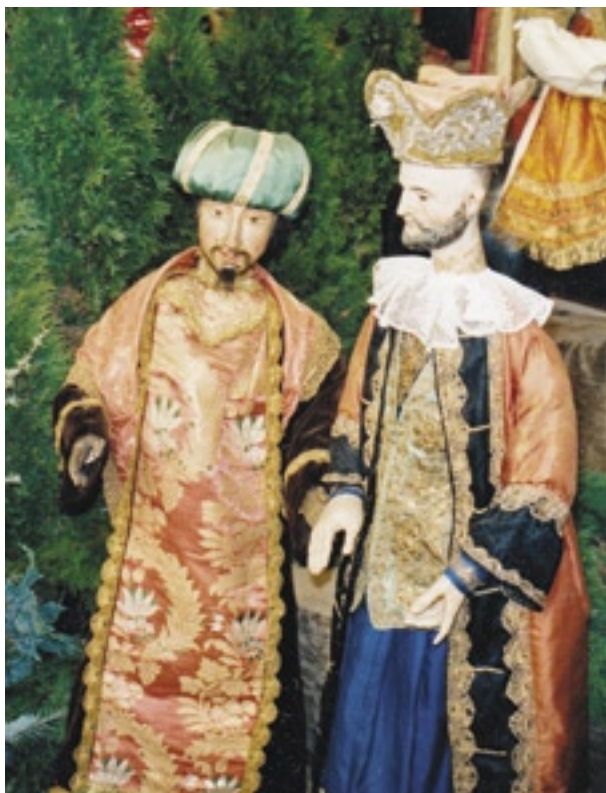
Mindelheim, jezuitský betlém