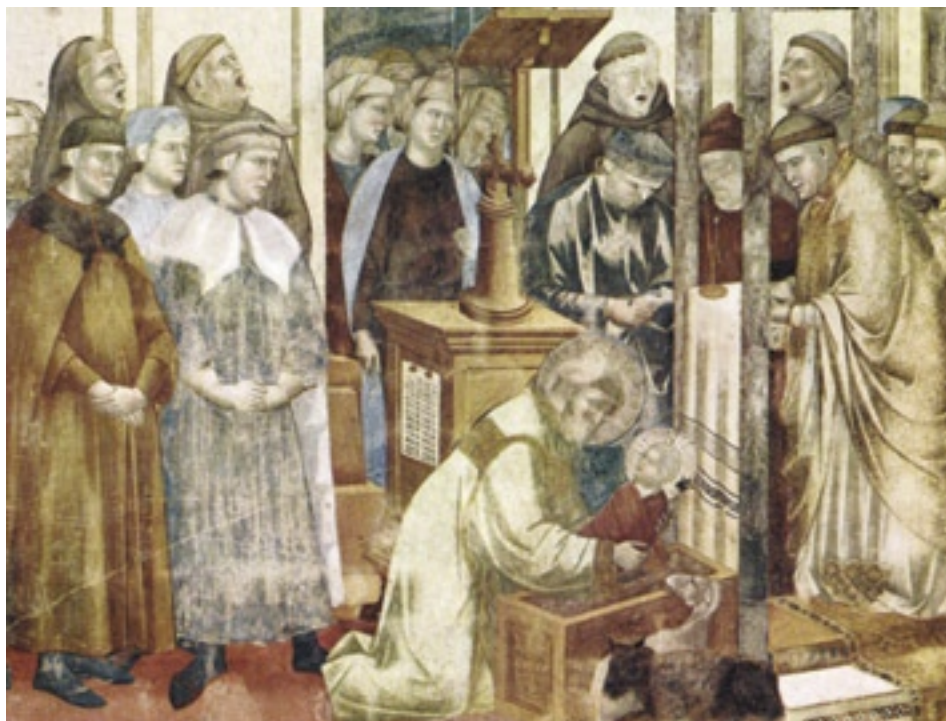
Giotto: Jesle v Grecciu , freska v Assisi 1280

Za počátek stavění betlémů se všeobecně považuje událost z roku 1223 v italském Grecciu. Mnich a zakladatel žebračského řádu františkánů sv. František z Assisi (1182–1226) postavil zde jesle a osla s volem a nechal sloužit mši, při které předčítal z Lukášova evangelia. Mnozí badatelé řadí tuto událost spíše mezi legendy a za skutečný vznik betlémů berou jako vyvrcholení dramaturgie liturgických veršů zpívaných střídavě sborem a knězem nebo dvěma sbory tzv. antifony, která se objevují od 5. st. při kostelních obřadech.