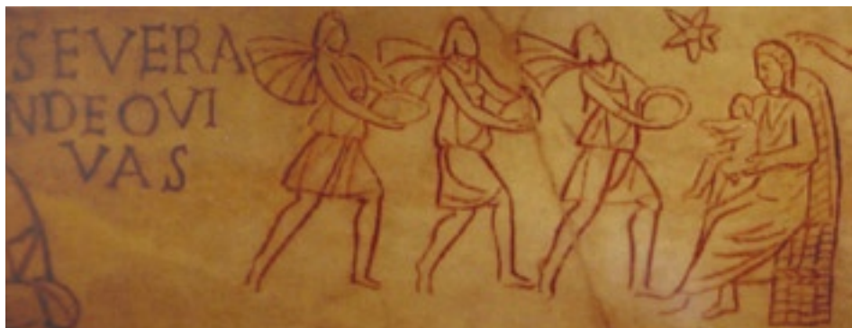
Klanění mudrců, kresba v římských katakombách 3. st, Vatikánská muzea

V počátcích křesťanského umění se odráží tehdejší vývoj teologického myšlení, se kterým je jakékoliv zobrazení úzce spjato. V době pronásledování křesťanů to jsou fresky v katakombách, které byly pojímány symbolicky, aby se vyhnuly všemu, co by mohlo připomínat modly či jejich kult. Nejstarší vyobrazení Narození je freska z katakomb svaté Priscilly datované do první poloviny třetího století. Znázorňuje Pannu s dítětem a postavu, která ukazuje hvězdu v horní části výjevu. Jde pravděpodobně o proroka Bileáma, neboť podle jeho proroctví je hvězda předobrazem samotného Krista („Vyjde hvězda z Jakuba, povstane žezlo z Izraele...“ (Nu 24,17)).