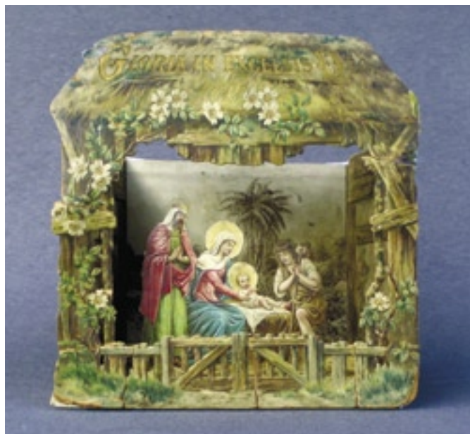
Starší papírový rozkládací betlém

Josef Führich, (1800–1850) rodák ze severočeské Chrastavy, část svých studií absolvoval i na pražské Akademii výtvarných umění. Jeho malířskou tvorbu lze charakterizovat jako romantickou se zvláštním důrazem na biblické náměty. Je považován za spoluzakla-