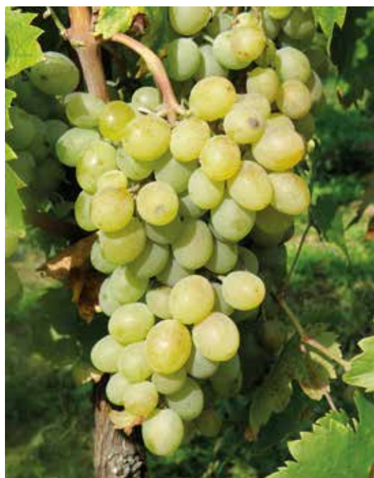
Hrozen stolní odrůdy Talisman