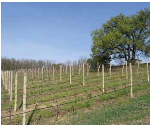
Stošíkovice na Louce, viniční trať U tří dubů

Oblast Znojemska leží v deštivém stínu Českomoravské vrchoviny tvořené prahorními útvary, jejichž výběžky daly na mnohých místech vzniknout kamenitým půdám vynikajícím pro pěstování bílých odrůd. Její nejvýhodnější výspou je Bobravská pahorkatina, okolo které jsou roztroušeny nejseverněji položené vinohrady této podoblasti.