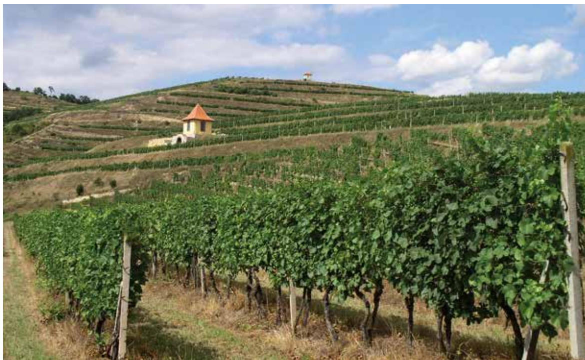
Viniční domek na vinici Žernoseckého vinařství

v přírodních podmínkách působí. Nejdůležitějšími složkami terroir jsou proto geologické podloží vinice a z něho vyplývající půdní podmínky, topografické parametry vinice, klimatické, kulturní a historické faktory. Hrozny a vína s charakterem terroir jsou vždy produkovány v určitém, přesně vymezeném a dobře charakterizovaném místě. Čím přesnější a užší toto označení původu je, tím bývá většinou i vyšší kvalita vyrobeného vína. Mezi vinohradníky se stále vedou diskuse, zda je terroir ovlivňované také činností člověka, a tedy jeho agrotechnickými zásahy ve vinici. Jelikož zásahy člověka přímo ovlivňují mikroklima vinice, je podle našeho názoru vhodné je za součást terroir považovat.