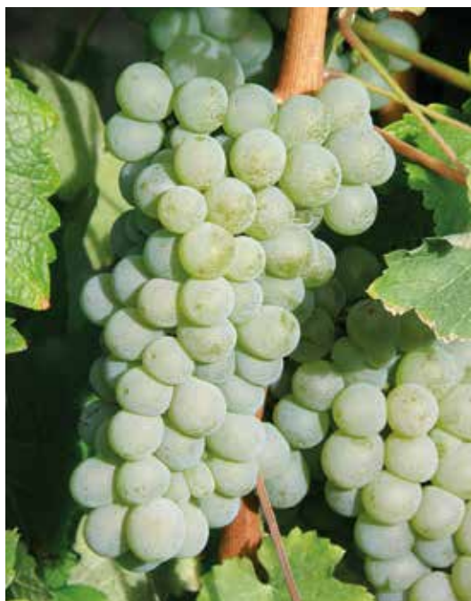
Hrozen moštové odrůdy Sauvignon

Ostatní vína, u kterých se nevyskytuje významný obsah oxidu uhličitého, tzn., že se v nich neobjevuje perlení, se označují za tichá vína .