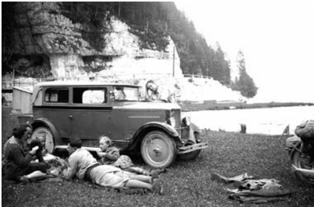
První automobil: Praga Piccolo v létě 1930 u Halštského jezera

Připomenutí zaslouží i praktické rady na další témata, např. Koupě nového nebo staršího vozidla, Program pravidelné péče o stroj, Na silnici v každém čase, Táboření s motorem, Porucha a nehoda, Do širého světa... atd.