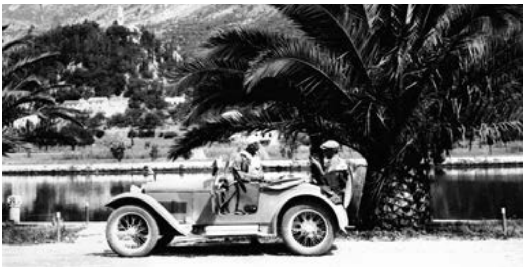
Jednoválcová aerovka trojici dovezla až k pobřeží Jadranu

V červenci 1932 se tříčlenná posádka s modrou aerovkou vydala k jihovýchodu, do Jugoslávie. Cestou museli překonat alpské průsmyky, i nejtěžší stoupání tam malý vůz s jednoválcovým motorem překonával vlastní silou, byť poněkud kuriózním způsobem. Nejprve mu odlehčovali tím, že jeden po druhém vystupovali a šlapali po svých. Když bylo nejhůř a všichni tři byli z vozíku venku, přišla na řadu metoda dvou silnějších klacků uříznutých v křoví u cesty.