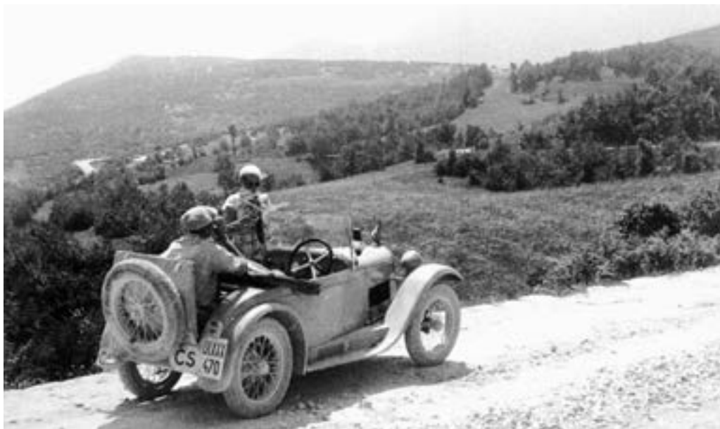
Dlouhonohý pasažér cestoval na vyklápěcím sedátku v zádi