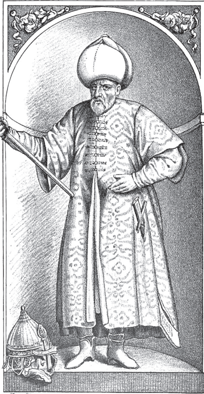
Mehmed Sokolović paša

V pořadí druhý za Sokolovičem, který zastával úřad velkovezíra od června 1566, stál bývalý velitel janičářů, šestaosmdesátiletý Albánec Mahmud Pertev paša. Malý postavou, ale jinak uznávaný velitel pozemních vojsk. Třetím v pořadí byl stejně tak „schopný voják, dobrý námořník“, bývalý vrchní velitel válečného loďstva, vítěz od Džerby, pětapadesátiletý Piali paša, původem Maďar nebo Chorvat, o němž se tradovalo, že ho našli jako opuštěné dítě někde u Bělehradu. Určitou zvláštností bylo, že spolu se jmenováním vezírem Selim II. odebral Pialimu, jenž byl zároveň jeho zetěm, velení nad válečným loďstvem. Za nového admirála si vybral Sokolovičova chráněnce, přibližně padesátiletého Aliho pašu,