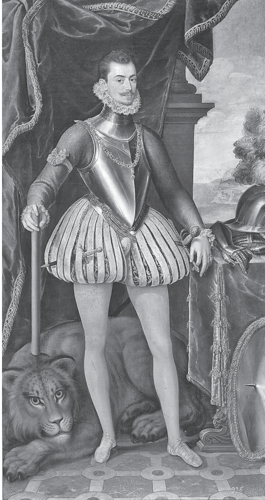
don Juan d'Austria