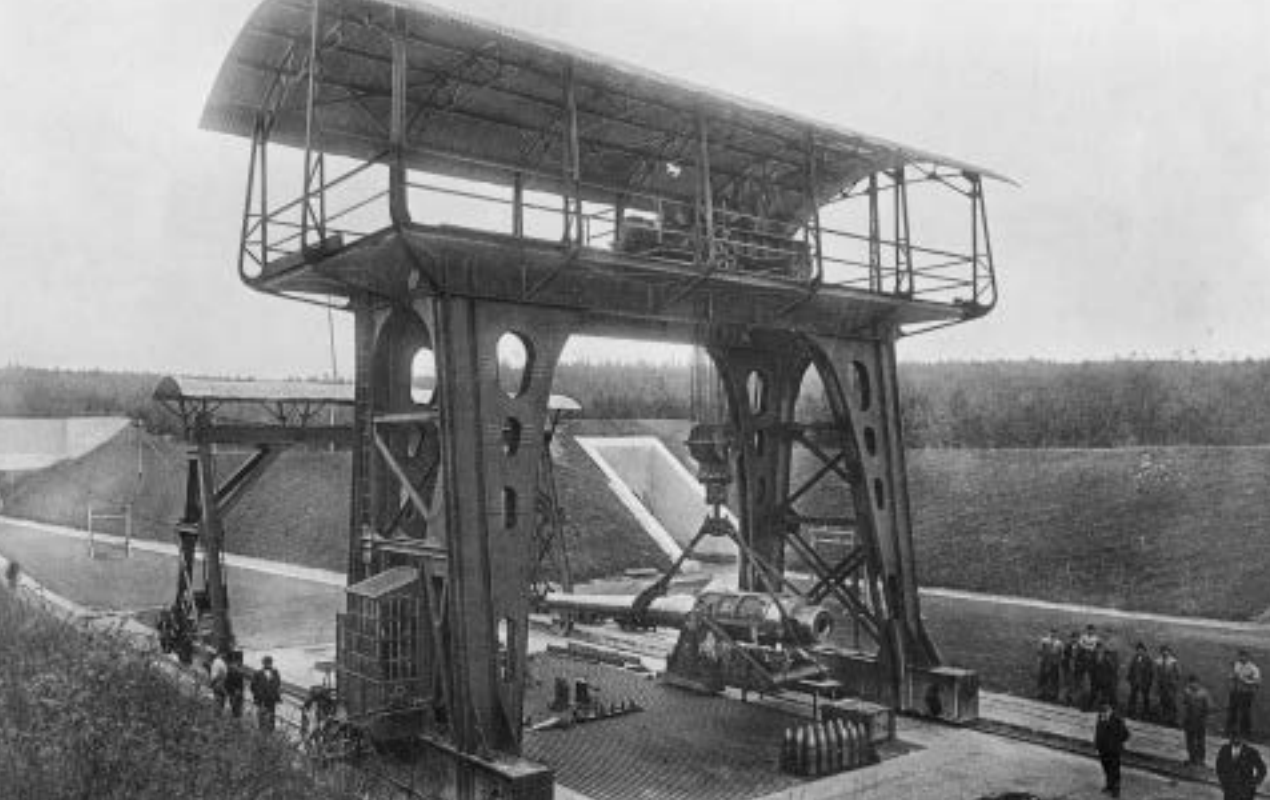
Jeřáb o nosnosti 80 tun, schopný zdvihat i nejtěžší děla na střelnici v Bolevci

ovšem s bronzovými hlavněmi z vídeňského arzenálu. V roce 1905 vyhrál soutěž o standardní lehký polní kanon ráže 8 cm pro rakousko-uherskou armádu německý typ Erhardt firmy Rheinmetall, opět s bronzovou hlavní a zavedený jako M.5 (M = vzor + rok zavedení)); na plzeňský závod zbyla pouze objednávka na 1200 lafet pro něj. Škodovácká konstrukční kancelář zbrojního oddělení, v níž vedoucí místa zastávali rakouští Němci (českých konstruktérů bylo pouze několik), přesto nadále pracovala velmi intenzivně a prakticky každý rok z ní vycházely nové typy horských a polních děl, pochopitelně s ocelovými hlavněmi. Odbyt ve větších počtech však stále nacházely jen v zahraničí. Od roku 1908 v Plzni pracovali na projektu těžkého mozdíře ráže 30,5 cm, který byl po úspěšných zkouškách zaveden jako 30,5 cm Mörser M.11 a stal se pak díky svým výkonům na bojištích 1. světové války jakýmsi symbolem Škodových závodů jako dělovky.