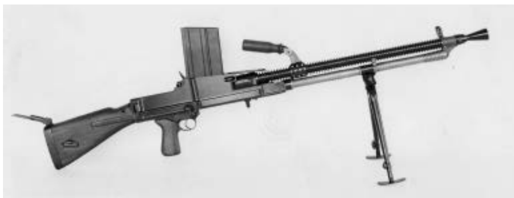
Asi neznámější a hojně exportovaná československá zbraň – lehký kulomet ZB vz. 26

Okupace Čech a Moravy nacistickým Německem v březnu 1939 a následné vypuknutí 2. světové války zde přinesly ještě intenzivnější rozvoj zbrojního průmyslu a to i na Slovensku, kde se nacházely pobočky mateřských firem z českomoravského prostoru. Pochopitelně valná většina produkce byla určena pro německé ozbrojené síly, přesto po celou dobu války pokračoval export zbraní nejen do zemí s Německem spojenecky svázaných, ale i vybraných zemí neutrálních. Stejně jako po 1. světové válce, kdy si výzbroj poraženého Rakousko-Uherska včetně děl ze Škodovky rozdělily vítězné a nástupnické armády, také po okupaci Československa veškerá výzbroj jeho zaniklé armády na území vzniklého Protektorátu Čechy a Morava, zčásti i na Slovensku, padla jako kořist do rukou Německa a to ji pak využívalo buď samo, nebo podle vlastního uvážení přenechávalo část z ní svým vazalům. Každopádně žádné bojiště 2. světové války se neobešlo bez zbraní vzniklých v českých, moravských i slovenských zbrojovnách v období od přelomu 19. a 20. století až po rok 1945.