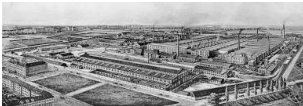
Pohled na Škodovy závody z roku 1907 představuje jejich velký rozmach.

Vlastní samostatné zbrojní oddělení Škodových závodů zahájilo svoji činnost 2. června 1890 se 60 stroji a stovkou zaměstnanců. Vedle toho pracovala ocelárna ve značné míře na zakázkách armády na pancéřové prvky pevností, kam putovaly od roku 1894 i kulometry, přičemž jejich dělovou výzbroj s bronzovými hlavními sice zabezpečoval vídeňský státní arzenál, pevnostní lafety však dodávala také plzeňská zbrojovka. Nový zbrojní provoz ale nezasobo-