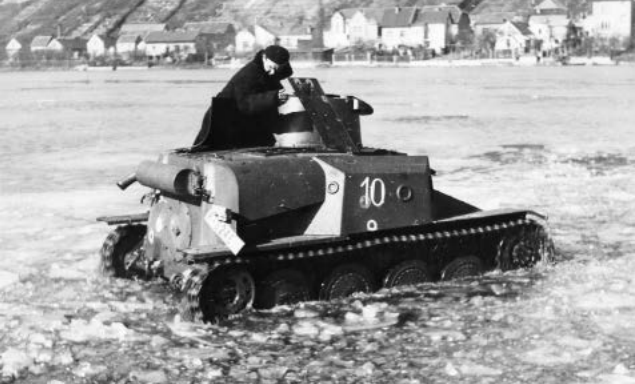
Tančík AH-IVHb určený pro Etiopii při náročných zkouškách před vyvezením v roce 1950

Zbraně vyvinuté zde, ale i jinde, a vyráběné československými závody či užívané domácí armádou putovaly do světa v ohromujících, na malý evropský stát skutečně neobvyklých počtech. Bylo to umožněno všestranným rozvojem průmyslu, bystrými nápady konstruktérů, solidní práci techniků a dělníků, šikovností obchodníků, ale i nejrůznějšími hospodářsko-politickými vlivy v průběhu oněch sta let. Za celým tím leckdy nepřehledným pohybem tohoto „železářského zboží“ se skrývá nespočet lidských příběhů, dnes již z valné části zapomenutých. Doufejme, že některé z těch, které jsou zaznamenány, zaujmou i dnešní čtenáře.