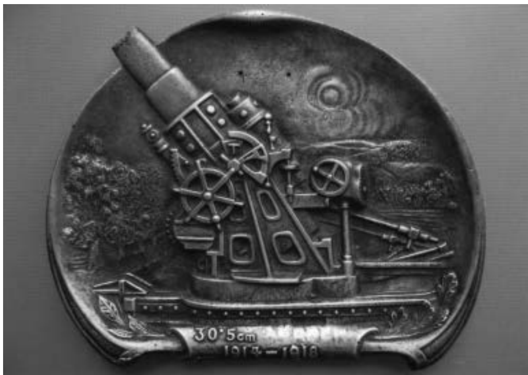
Pamětní plastika s vyobrazením nejznámějšího škodovického děla, 30,5cm moždíře

V průběhu oněch sta let se zbraně z českých, moravských i slovenských zbrojovek dostaly přímým vývozem do více než 90 zemí, někam v desítkách kusů, jinam v počtech statisícových. Dnes je nejspíše valná většina z nich přetavena na předměty mírového využití, jiné se válí jako šrot na bývalých bojištích, ale nemálo je i těch, které dodnes rozsévají smrt v ruce vojáků i neregulérních ozbrojenců. Ve sbírkách muzeí a na pomnicích minulých válek připomínají svoji slavnou i méně slavnou kariéru v různých koutech Evropy i jinde ve světě. Je dobře, že některé kdysi vyvezené či do ciziny zavlečené československé zbraně se vrátily domů, do České republiky, aby v muzejních expozicích po pečlivém restaurování připomínaly dávné boje, jichž se účastnily, i technický um jejich tvůrců. Je to zásluha řady muzejníků oficiálních i soukromých, kteří těmto „navrátilcům“ věnovali stovky hodin práce. Díky archivům výrobních podniků a vojenských institucí se podařilo u několika z nich sestavit jejich „životopisy“, které tvoří závěrečnou pasáž textu knihy.