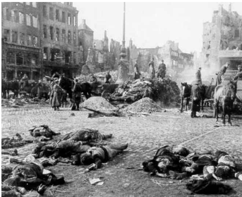
Oběti bombardování v Drážďanech