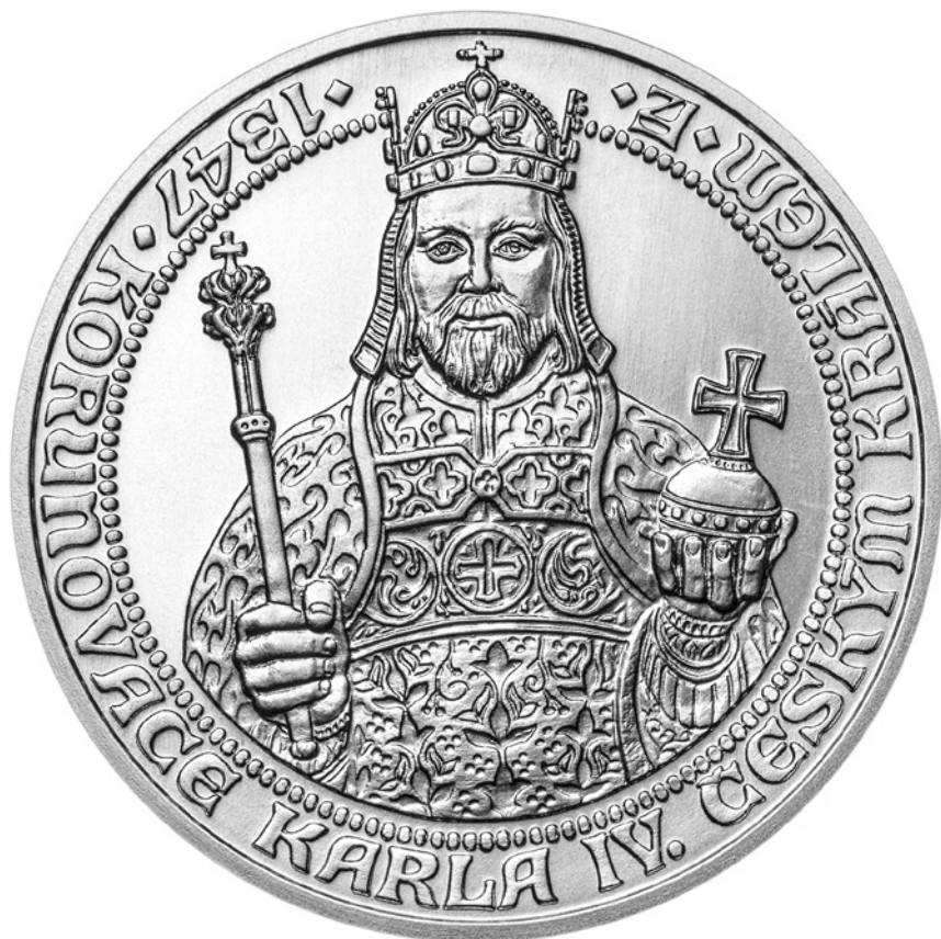
Korunovace Karla IV.