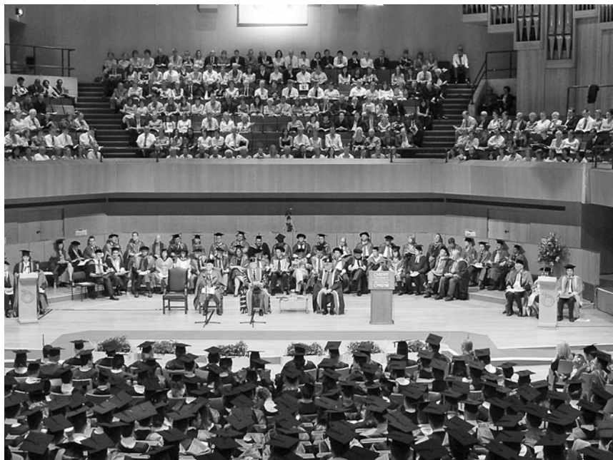
Promoce na univerzitě v Cardiffu.

Každý z nás, kdo má akademický titul, to zažil. Každý byl uchvácen onou starobylou atmosférou, která nás během tohoto slavnostního