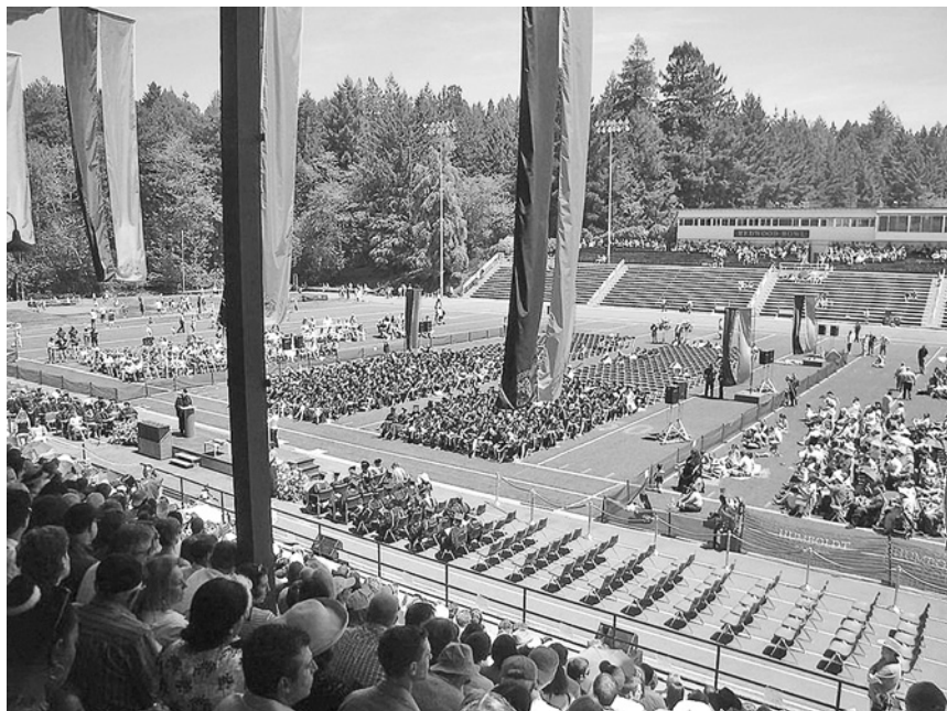
Promoce Humboldtovy univerzity je velkolepou slavností.