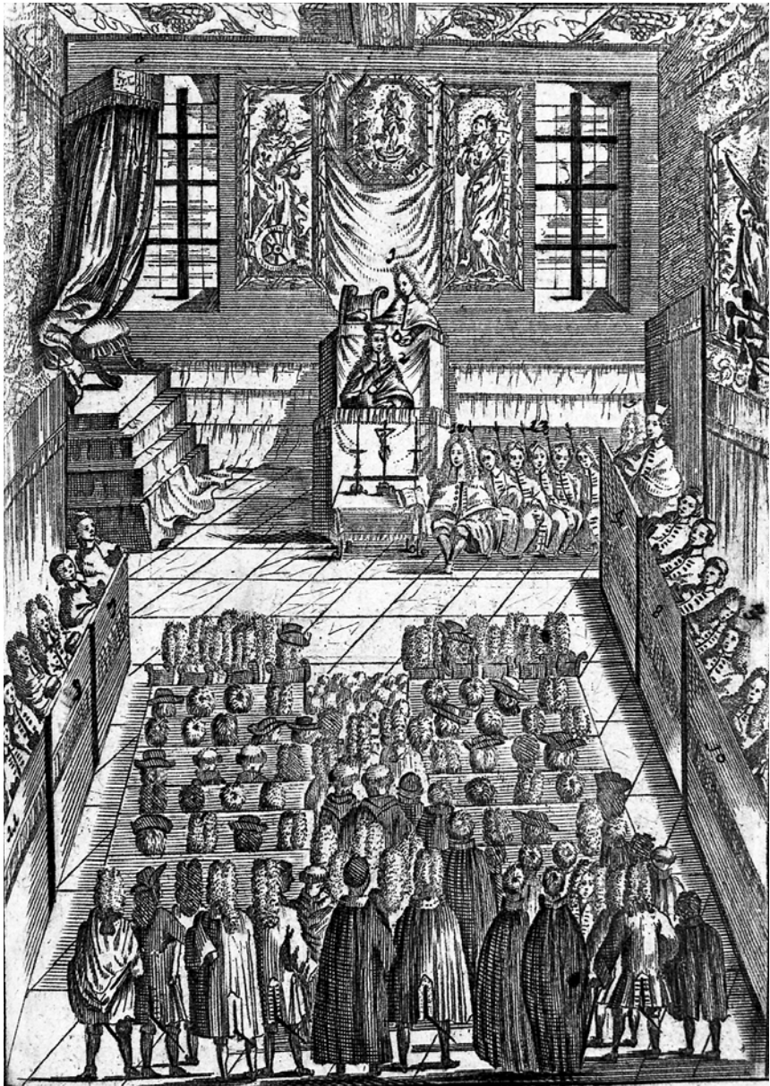
Incolatus et investitura – tak to chodilo za starých časů.