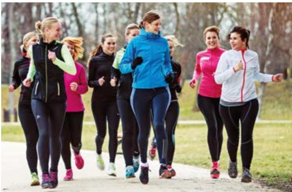
Běh jako vynikající pohybový prostředek a lék na psychiku

I když ještě ani zdaleka nevíme o běhu všechno, jednu jistotu potvrzenou vědeckým výzkumem máme. Pro současného člověka je běh vynikající prevencí stále expandujících civilizačních onemocnění. Jejich hlavní příčinou je stále nedostatečné přirozené pohybové zatížení. Důsledkem nebo jakousi civilizační daní jsou v první řadě choroby srdce a krevního oběhu, často podmíněné i nadváhou (infarkt myokardu, vysoký krevní tlak, mozková mrtvice) a další onemocnění jako např. cukrovka. Běh je za této situace i lékem dostupným prakticky všem. U běžajících lidí je počet civilizačních onemocnění výrazně nižší. Naše osobní zkušenosti i výzkumy uvedené argumenty jen potvrzují. Aby tomu tak ovšem skutečně v praxi bylo, je velmi důležitá správná metodika běhu,