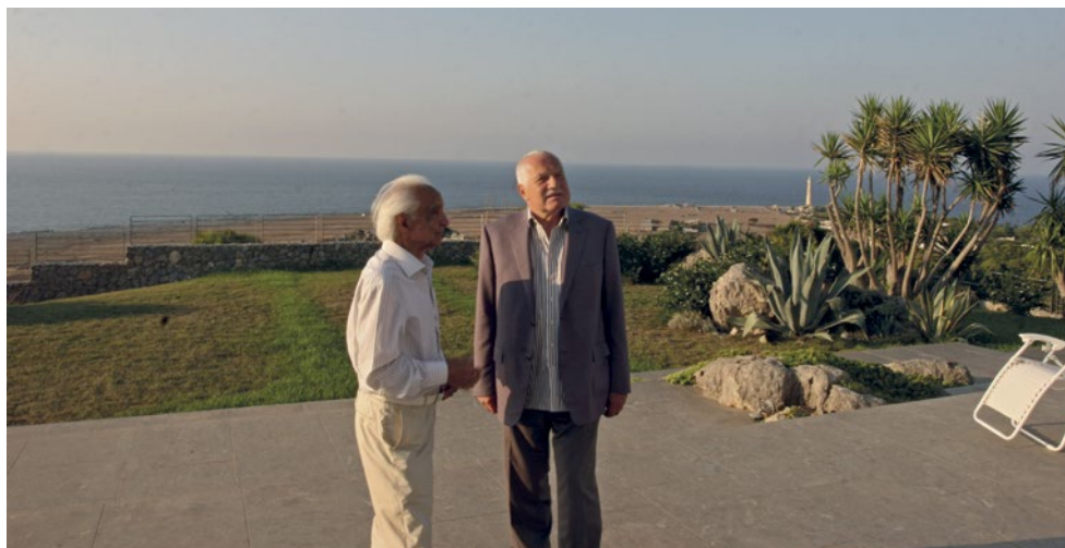
S profesorem Zichichim.

přímořském městečku San Vito Lo Capo na večeri, vzpomínal, co mu řekl Fermi, co John von Neumann, co Teller, co spousta dalších slavných jmen. Vůbec jsem netušil nic o vědě na Sicílii, určitě ne o matematické škole v Palermu známé od konce 19. století, která dala prof. Zichichimu dobré matematické základy.