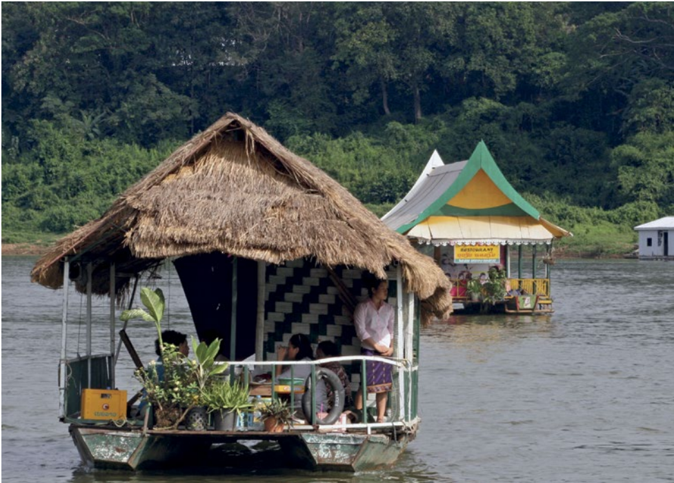
Lodě plující po jednom z ramen Mekongu.

V Laosu mnozí z nás nebyli, já také ne. Je to podobně jako Česká republika země bez přístupu k moři, ale s jednou z největších řek světa – Mekongem, který spojuje celou jihovýchodní Asii. Země je svou rozlohou třikrát větší než ta naše, ale má jen něco přes 6 milionů obyvatel. Země je to historicky stará, první státní útvar, království (jmenovalo se moc hezky – „Království milionů slonů a bílého slunečníku“), tam vznikl již v roce 1353. Od konce 19. století byl dnešní Laos součástí Francouzské Indočíny, což definitivně skončilo až spolu s koncem vietnamské války. Laoská lidově demokratická republika – dodnes komunisticky orientovaná – vznikla v roce 1975.