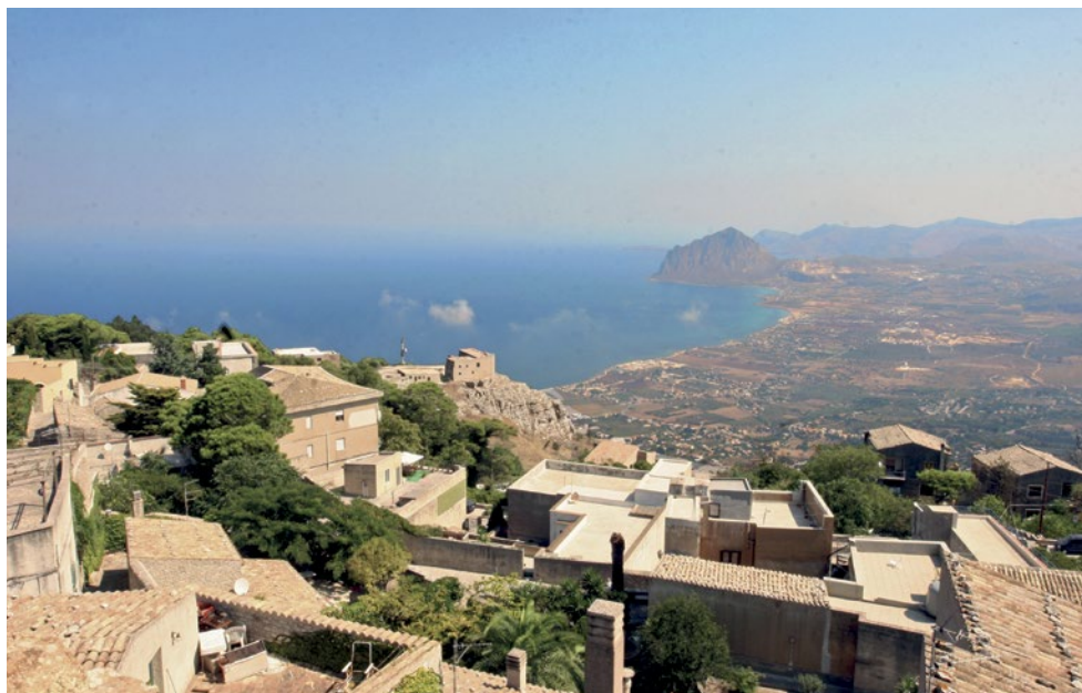
Pohled na Trapani.

Sicílie – jako jeden ze čtyř italských autonomních regionů – má 5 milionů obyvatel, tedy zhruba polovinu České republiky. HDP na hlavu zde dosahuje jen o něco více než polovinu úrovně střední a severní Itálie. Míra nezaměstnanosti se blíží k 20 %, zaměstnaná je jen jedna žena ze tří. Do věku 24 let nemá práci více než 50 % mladých lidí.