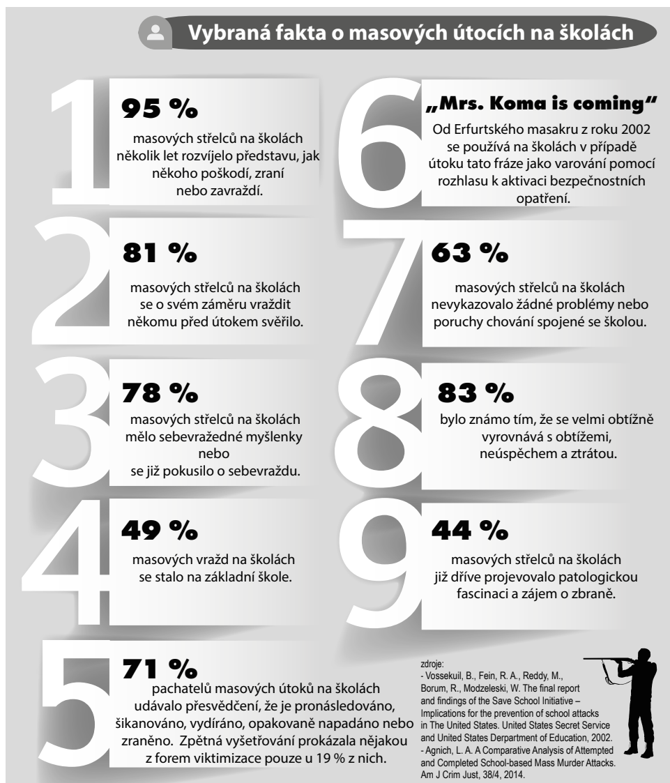
Obr. 2 Vybraná fakta o masových útocích na školách

a posléze se třeba vrátit k sériovým činům, které mají zase odlišný charakter, někdy i mírně jiný motiv a provedení. Jejich dopadení a psychologické profilování je zdaleka nejnáročnější, leckdy jsou dopadeni spíše na základě náhody nebo nejsou dopadeni vůbec. Je to v podstatě takový kombinovaný a profilově hybridní mnohonásobný vrah.