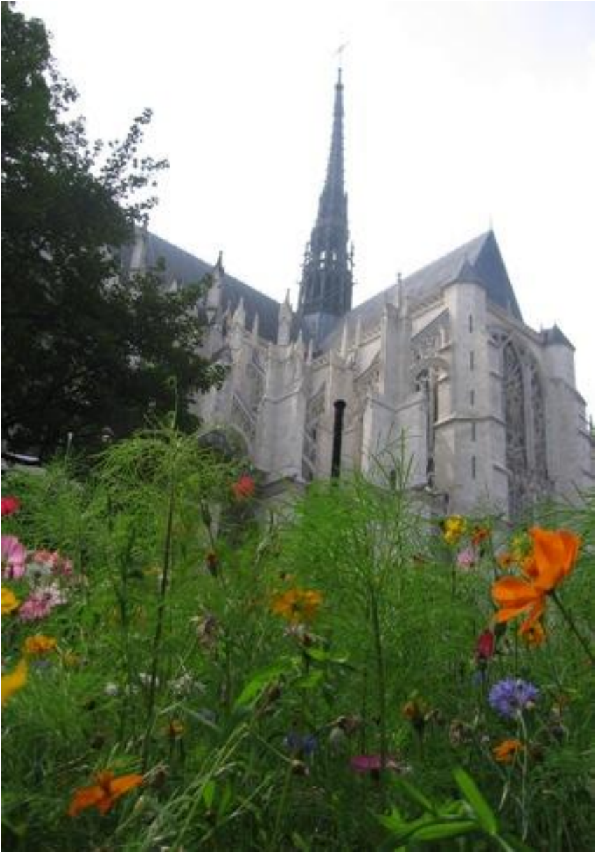
Katedrála v Amiens