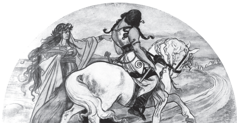
Romantická představa starých Slovanů na luneti Mikoláše Alše Žalov

ského vzoru kamennou rotundu sv. Petra. Byla to tehdy po kapli sv. Klimenta na Levém Hradci a nedochovaném kostelíku Panny Marie na Pražském hradě v pořadí třetí křesťanská církevní stavba v Čechách. Dnešní rotunda sv. Petra a Pavla však svou definitivní podobu získala teprve po přestavbě v 17. století, byť si uchovala výrazné románské prvky.