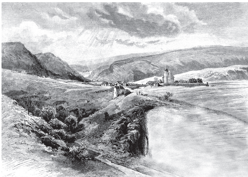
Celkový pohled na Levý Hradec

kázal archeologický průzkum, mnohem mladší. Však se k němu v této knize ještě dostaneme. Chceme-li však najít to skutečně nejvýznamnější hradiště kmene Čechů, musíme se vydat na Budeč u Zákolan na Kladensku. Podle pověstí je spojeno se jménem dávného soudce a knížete Kroka. Přečtěte si, co o tom napsal Václav Hájek z Libočan: „Lid ten český, velikú chut majíce ku pánu svému Krokovi a vidúce jeho velikomocnost, jemu poctivost a bezpečnost aby činili, všemi obyčeji obmejšleli. Dne jednoho sešli sú se na dvůr Černoušuv a odtud do Ctiňovsi společně přišli a pánu svému mnohé věci budúcí skrže Slavboje, syna Lesislavova, předkládali. A při konci jeho to pověděti rozkázali, že sú se o to snesli a na tom zůstali, aby v místě slušném a bezpečném město a hrad postavili