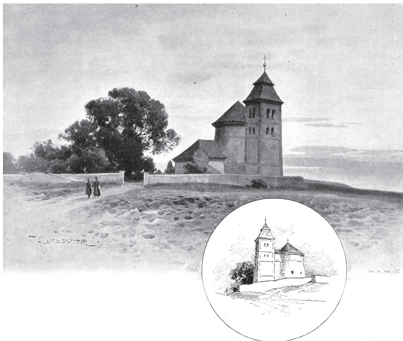
Kostelík sv. Petra a Pavla na Budči na kresbě Karla Liebschera

pak Libušín a na východ Šárka a Levý Hradec, zatímco na opačném břehu Vltavy leželo hradiště u Klecan. Přírozenou dominantou tohoto kraje se stala na severu čedičová kupa Řípu, v jejíž těsné blízkosti však navzdory dávné pověsti postrádáme jakékoliv stopy po starším slovanském osídlení.