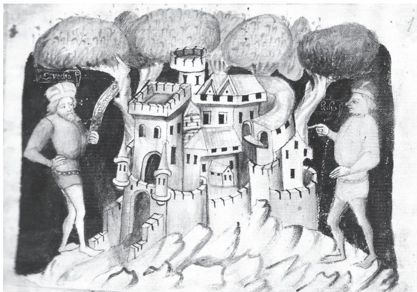
Bratři Čech a Lech na iluminaci z Budyšínského rukopisu Kosmovy Kroniky české

tější dohady. Autor, jenž se chce zabývat událostmi, bezprostředně předcházejícími vzniku českého státu, se tak trochu ocitá ve stejné situaci jako dávní kronikáři, kteří nedostatek hodnověrných zpráv přechasto nahrazovali vlastní schopností fabulovat dramatické příběhy. Často se přitom inspirovali i cizími literárními zdroji, v nichž pak k svému velkému překvapení nacházíme nečekané souvislosti s českými dějinami. S odstupem staletí se pak můžeme jen ptát – byla to pouze náhoda, nebo záměr?