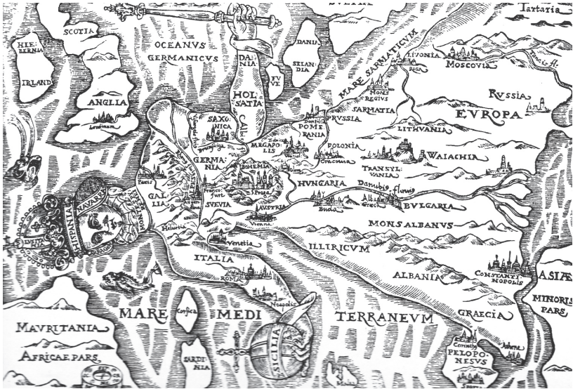
Renesanční mapa Evropy jako císařovny. Čechy jsou šperkem zavěšeným na její hrudi

a doložená plejádou skvělých skladatelů a hudebníků? O století později nechal jezuitský dějepisec a vlastenec Bohuslav Balbín vykreslit v mapové alegorii Čechy jako růži. Dnešní milovníci záhad v tom spatřují narážku na tajné Bratrstvo růže a kříže, prý spojené s významným anglickým matematikem, okultistou a alchymistou na dvoře císaře Rudolfa II. Johnem Deem a také se „zimmním“ králem Fridrichem Falckým.