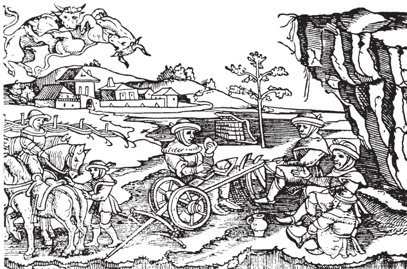
Přemysl Oráč svačí na pluhu, dřevořez z Kroniky české od Václava Hájka z Libočan

v čelo po svrchu řečeném knížeti vladaře neboli vévody z jeho potomstva, sloužící modlám a bůžkům a bujně slavíce oběti podle pohanských obyčejů, až nakonec vláda nad touto zemí připadla jednomu z rodu těchto knížat, jménem Bořivojovi...“