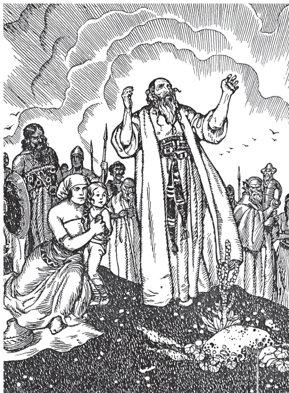
Praotec Čech na Řípu. Ilustrace Josefa Weniga

takříkajíc ode všeho trochu a rozhodně to není žádná nuda, když se vydrápeme na kopec s rozhlednou a popatříme kol dokola. Krajina je v Čechách i na Moravě pestrá, pole se střídají s loukami a lesy, stříbrné hladiny rybníků a řek se lesknou ve slunci, kopce se prolínají s nížinami a silnice spojují lidská sídla jako šňůrky jednotlivé korálky. Máme u nás horské pláně, kde roste jen kleč a kosodřevi-