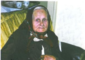
Stařa, babička „hůlková“

Narodil jsem se 13 dubna 1938 v Prostějově. Ne v nemocnici, jak je dnes zcela běžné, ale doma. Vždy jsem si myslel, že se tak