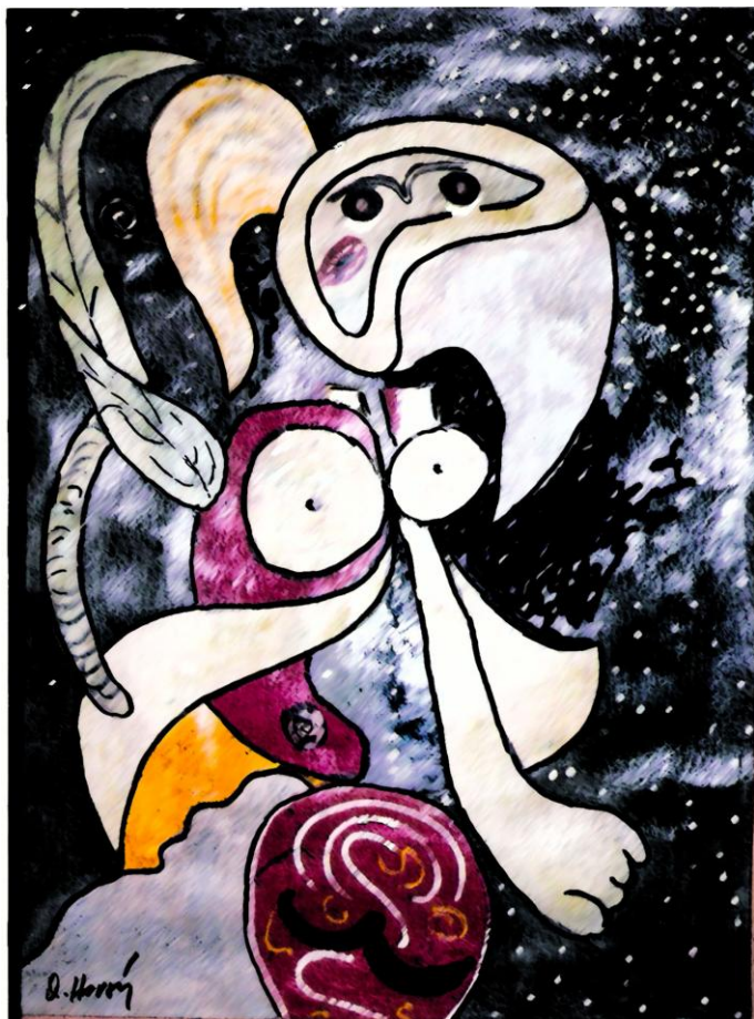
Moje manželka Olga, akvarel, 1972.