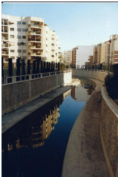
Kanalizace řeky Segura, stav v roce 1993 a v roce 1996.