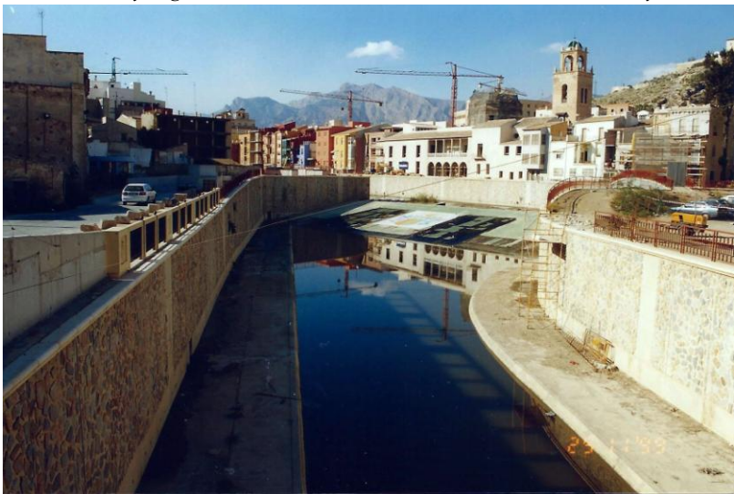
Kanalizovaná řeka Segura v Orihuele je vizitkou vysoké úrovně českých odborníků. Vyústění kanálu do splavu a dále do řeky. Foto Otto Horský 1999.