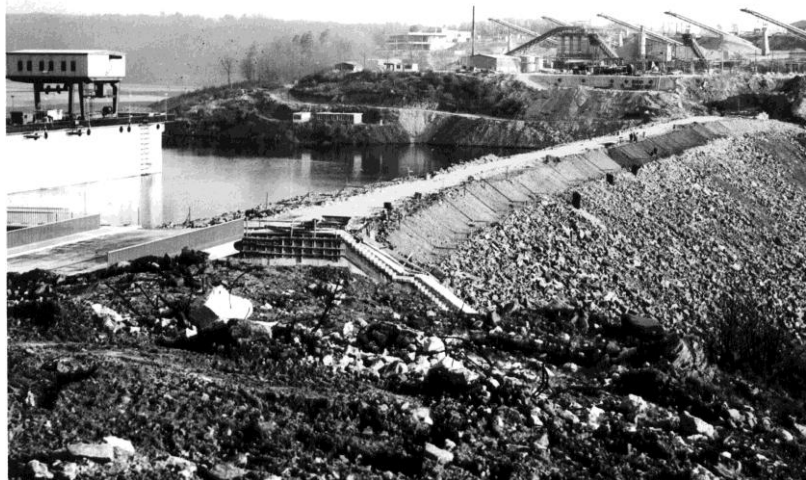
Výstavba sypané zemní hráze v Dalešicích. Stav roce 1973.