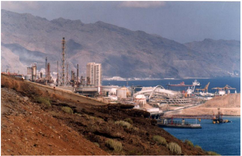
Studie kontaminace zemin znečištěných ropnými produkty a návrh dekontaminace v oblasti rafinerie v Santa Cruz na Tenerife realizoval Geotest Brno ve spolupráci s Geinzou, S.L.