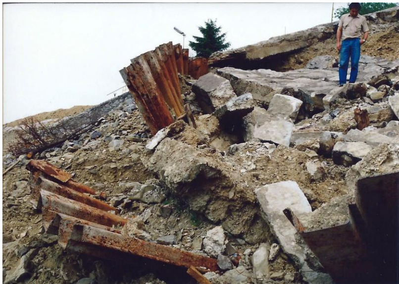
Vlnbitím a dalšími vlivy devastované přístaviště lodí na Oravské přehradě v severozápadním Slovensku. Foto Otto Horský, 1991.