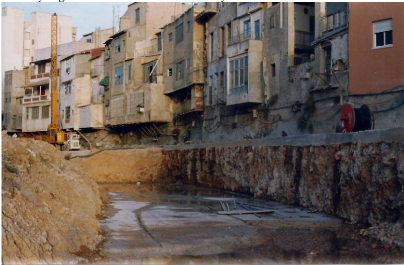
Pohled na budovanou kanalizaci řeky Segura v historické části města. Stěny kanálu byly založeny těsně pod budovami moderní metodou tryskové injektáže – Jet Grouting, která nevyvolává vibrace, ohrožující stabilitu budov. Otto Horský 1993.