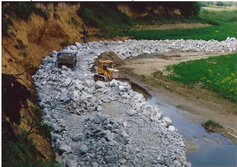
Sanace břehové linie kamenným záhozem jako opatření proti vlnbití. Stav 1996.