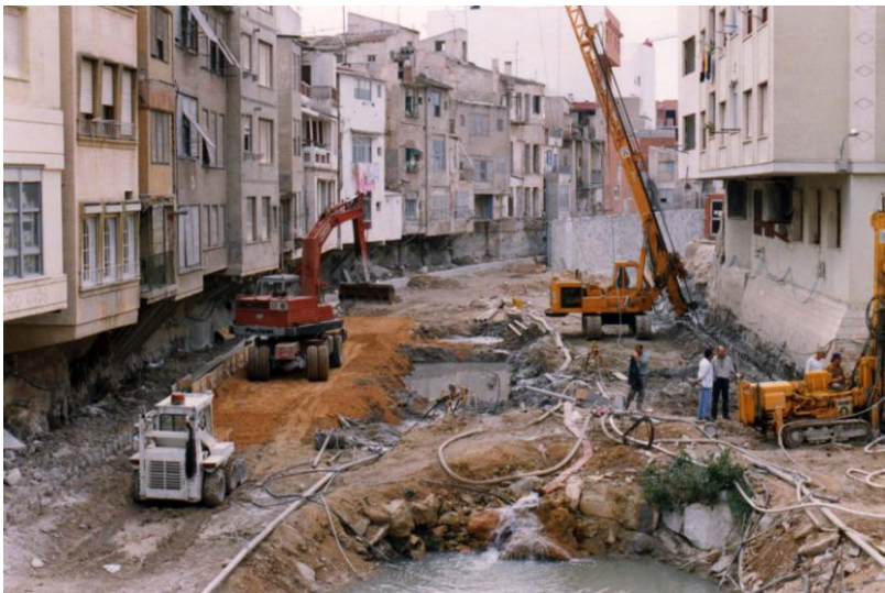
Stavební práce, realizované Zakládáním staveb Praha a Geinzou, S.L. při kanalizaci řeky Segura v Orihuele. Foto Otto Horský 1993.