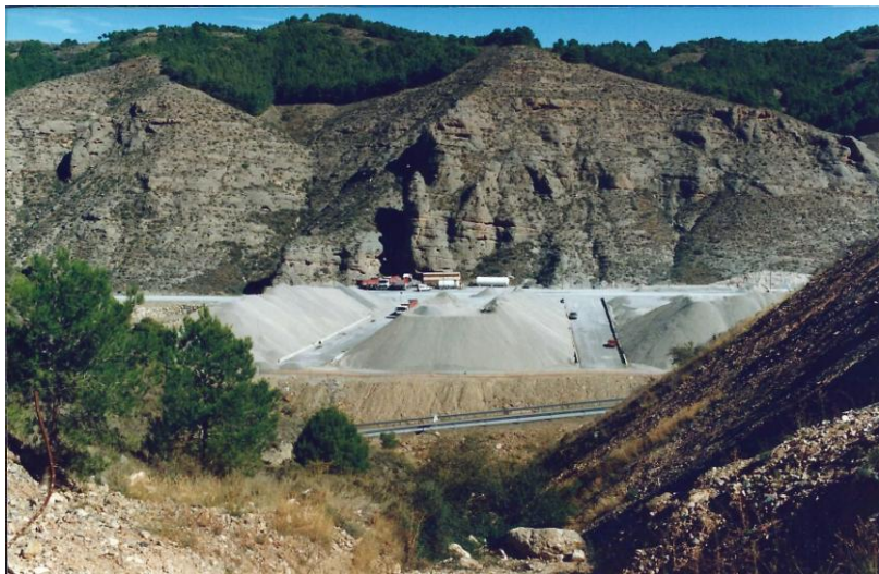
Přehrada Val ve výstavbě. Pohled na stavební dvůr a tříděné konstrukční materiály pro výrobu betonové směsi. Foto Otto Horský 1996.