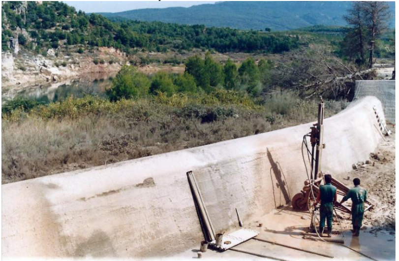
Provádění injekčních prací na přehradě Guiamets-Falset na řece Asmat v provincii Tarragona s cílem snížení průsaků pod hrází. Foto Otto Horský, 1996.