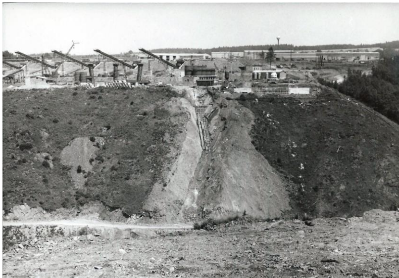
Výstavba sypané zemní hráze v Dalešicích. Stav roce 1972.