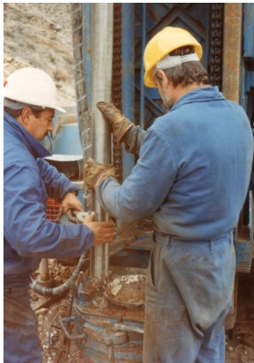
Geotechnický dozor při provádění vodních tlakových zkoušek propustnosti při výstavbě přehrady Val u Tarrazony, provincie Zarragoza. Foto Otto Horský, 1993.