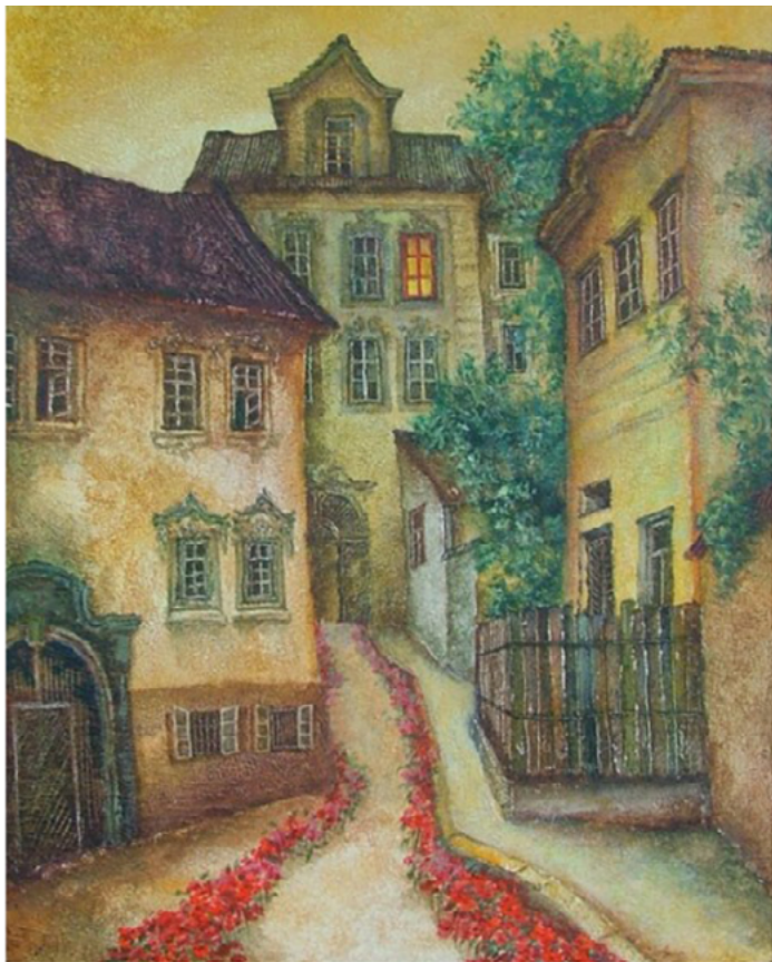
Cesta k nám, Simonetta 2006