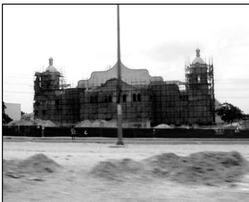
▲ Bleskové foto čela katedrály v Luandě

Vlevo je zajímavá stavba, můj oblíbený červeno-bílo-šedo-černý stadion, no a pak dál kolem areálu CHINA JIANGSU míříme do Viany se supernovými domy obklopujícími už skoro hotovou baziliku – a objekty této církevní stavby jsou tak obrovské, že mají být největší v této části Afriky. Čelo této – vzadu přísně funkční – stavby je pojata ve stylu staré katolické katedrály, s mohutným štítovým portálem se dvěma věžemi v čele. Vzadu pak s malou strážní věžičkou.