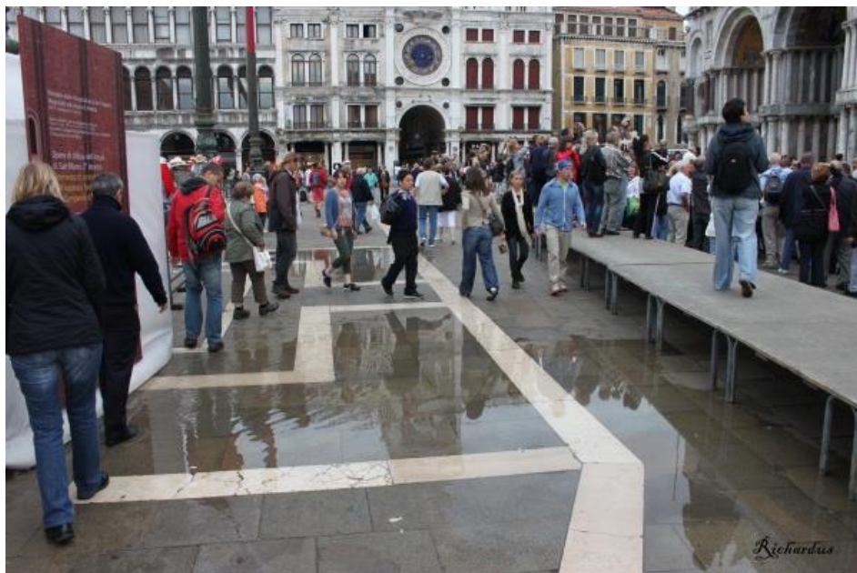
Obrázek: Lavice pro chození při vysoké vodě