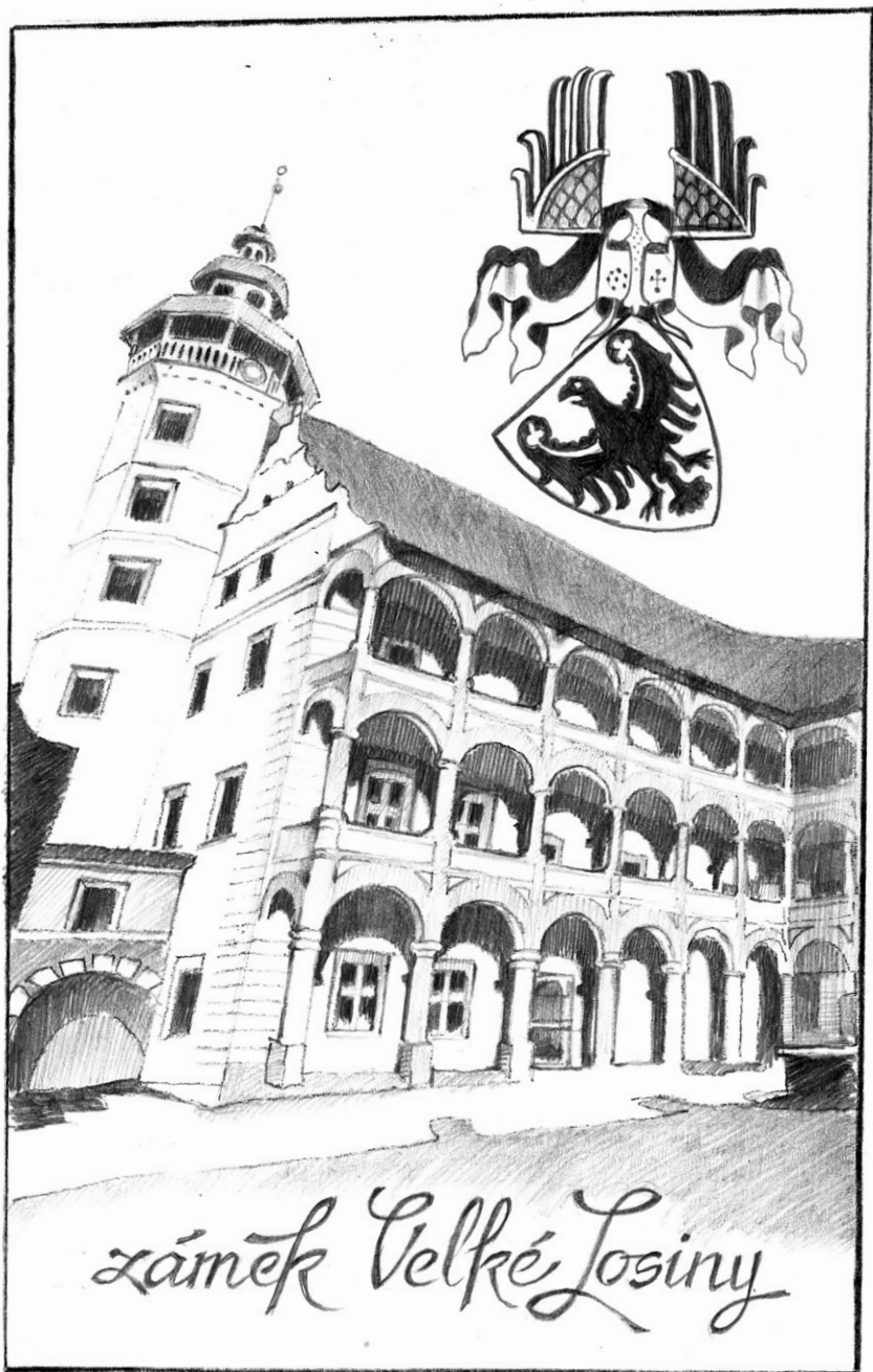
zámek Velké Losiny