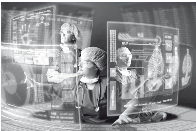
Obr. 1 Reklamní fotografie eHealth

Tato učebnice je primárně určena především studentům medicíny a lékařům, kteří se o nové obory eHealth a telemedicínu zajímají. Pojem eHealth se do zdravotnictví dostal na přelomu 20. a 21. století. Elektronizace zdravotnictví souvisí s rychlým rozvojem informačních a komunikačních technologií. Propojením výpočetní techniky s medicínou vznikl nový obor, který používá název eHealth. V době vydání této knihy lékařům a zdravotníkům u nás pod kůži moc nejde. Podíváte-li se na různé konference a odborná sympozia s uvedenou tematikou, jednoznačně vidíte převahu nadšených inženýrů nad doktory. Lékaři zapojení do elektronizovaného zdravotnictví zůstávají zatím hlavně na reklamních fotografiích (obr. 1).