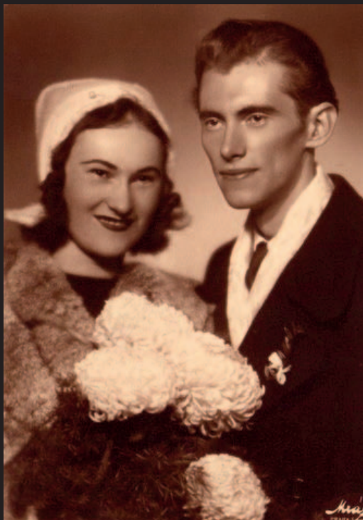
Svatební foto rodičů