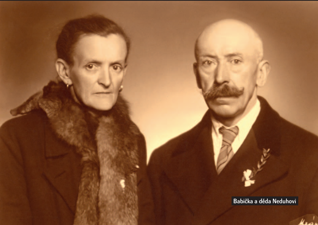
Babička a děda Neduhoři