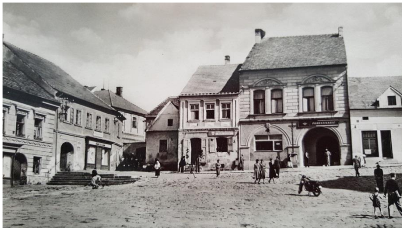
Trhové Sviny mého mládí

Na štěstí se tatínek do roka vrátil živý a zdravý zpět do nově vzniklé Československé republiky. Ve škole se obrazy císaře Karla vyměnily za portrét našeho prvního prezidenta Tomáše Garrigua Masaryka.