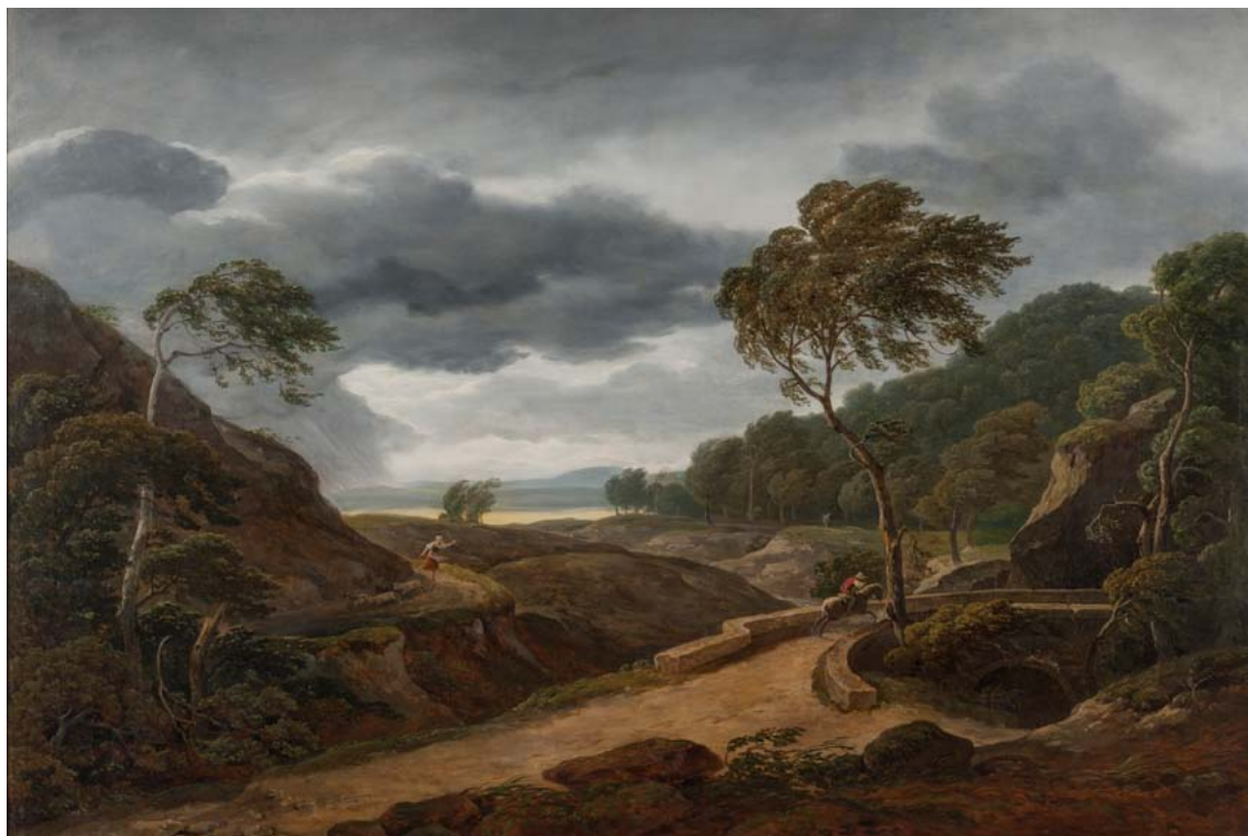
Antonín Mánes, Bouře u Cibulky, 1840