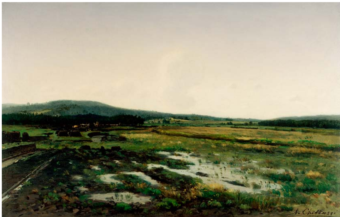
Antonín Chittussi, Močály u Člunku, asi 1885