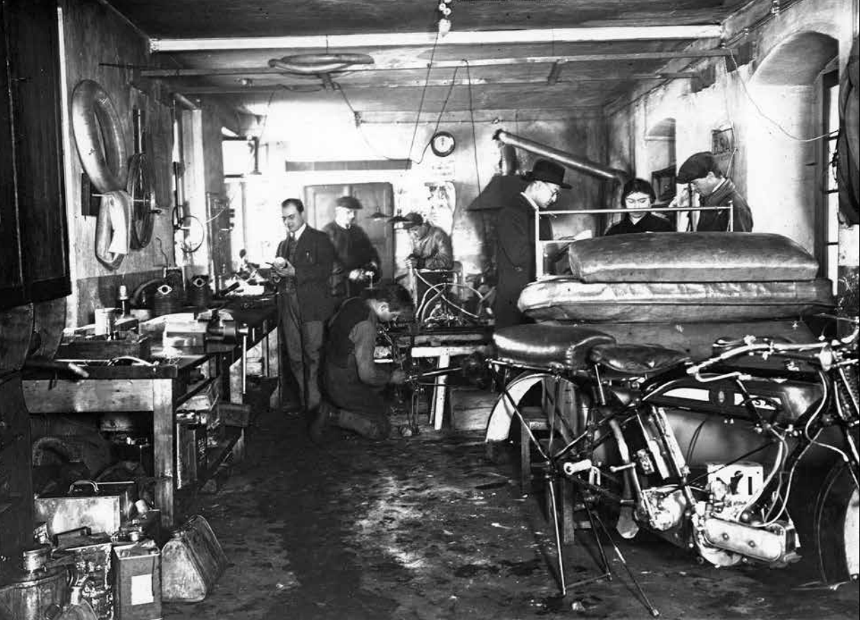
Showroom, dílna i debatní místo na Malé Straně