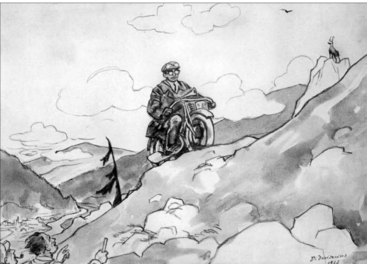
Augustin Šulc na karikatuře Desideriuse z roku 1927 při zdolávání Tater na motocyklu BSA

být jistá, že se za chvilku otevrou dveře a vejde tatínek se slovy: