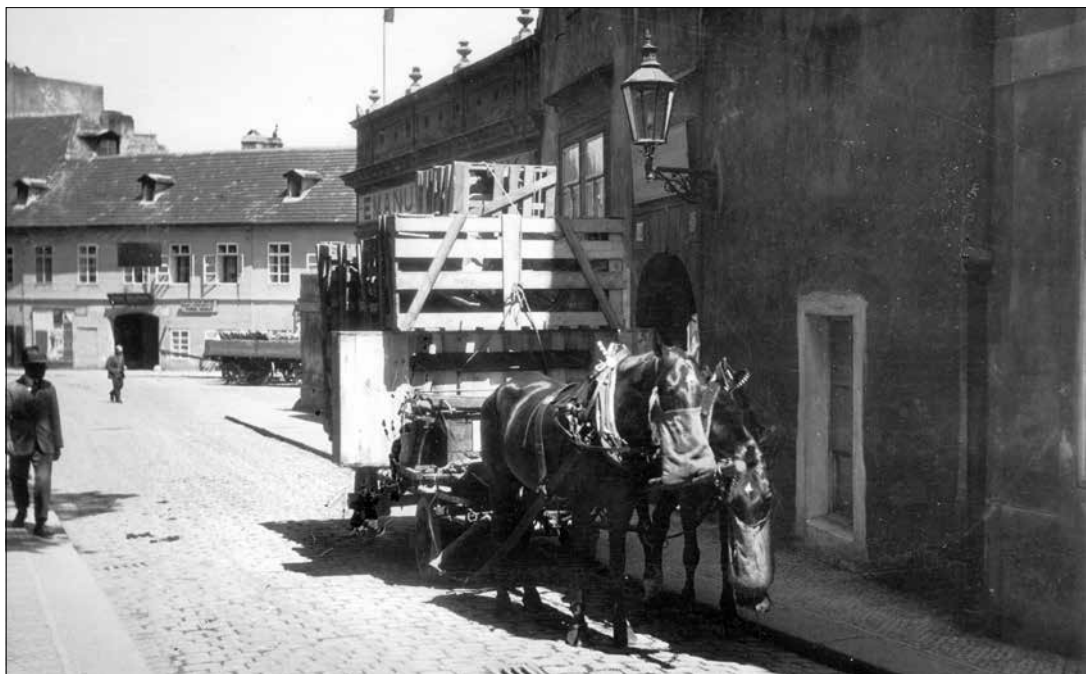
Povoz odváží ulicí U Lužického semináře prázdné dřevěné přepravní klece, z nichž za rohem vybalili motocykly BSA