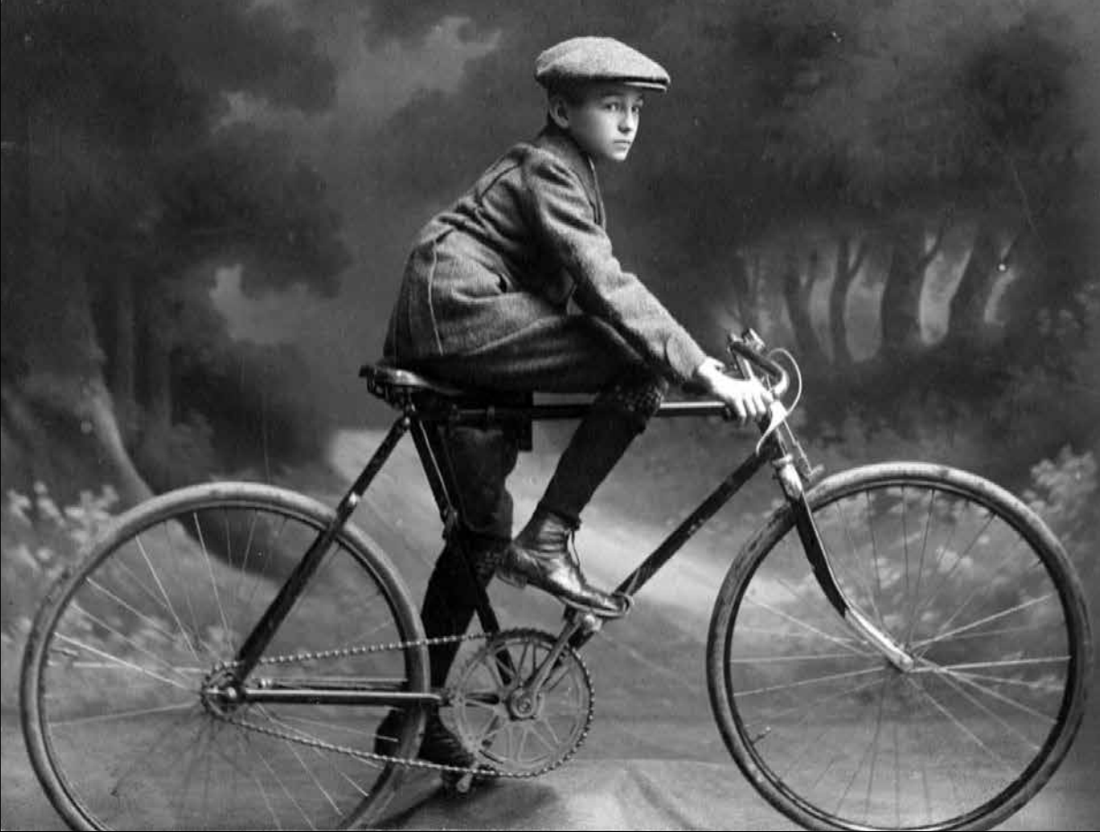
První kolo Augustina Šulce. Běžný typ stál asi 70 korun, sportovní BSA přišlo na 240 K

při prochladnutí byly bolesti nesnesitelné. Teprve ke konci jejího života ji operace zbavila dlouholetého trápení. V dobré pohodě se dožila 74 let.