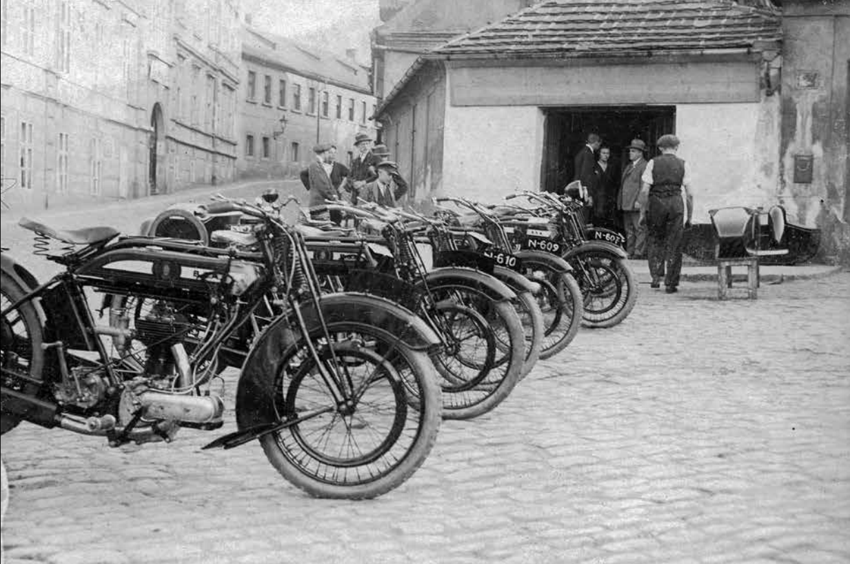
První dílna na Malé Straně mezi ulicemi U Lužického semináře a Cihlářská