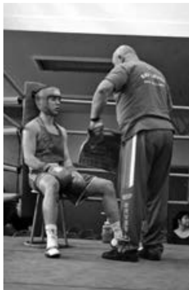
Boxer v rohu s trenérem, MČR juniorů 2016

Jak už jsem se zmínil, box je tvrdý sport, který je nejen náročný na fyzickou kondici, ale navíc bolí. Někde jsem četl diskusi, kdy se mladý potenciální boxer ptal, jestli box bolí. Odpověď byla prostá – ano, box