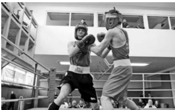
Zápas MČR juniorů 2016

Box patří mezi individuální úpolové sporty, dynamicko-silové s vysokou koordinační náročností. Starší název pro box zní rohování. Jiná klasifikace ho řadí mezi sporty heuristické. Často je popisován jako pěstní souboj dvou soupeřů (šerm rukou) zhruba stejného věku a stejné váhy. Cílem sportovního výkonu je zvítězit nad soupeřem pomocí úderů, úhybů a krytů povolenými pravidly AIBA.