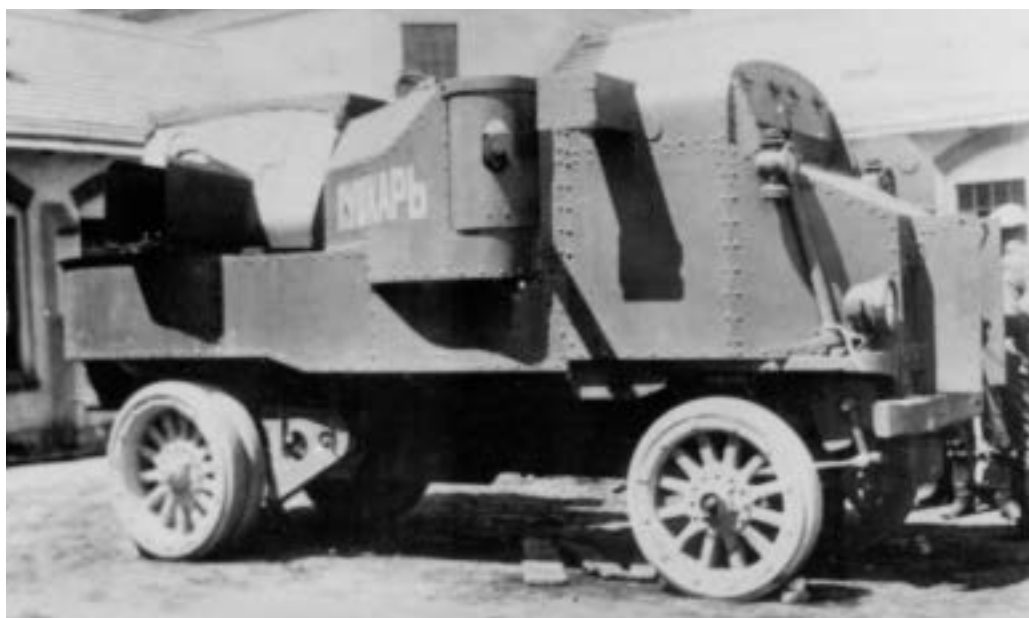
Těžký obrněný automobil Garford měl silnou výzbroj – tři kulomety a děla ráže 76,2 mm.

Tanky se jako zbrojní novinka objevily v polovině 1. světové války v britské a francouzské armádě, o něco později i v německé, zatímco ruská armáda touto technikou nedisponovala. Na druhé straně se v ruské armádě v letech 1914–1918 rozšířily v míře jinde nevídané obrněné automobily, převážně opancéřované a vyzbrojené v Rusku s využitím osobních či nákladních automobilů dovezených z Anglie, Itálie nebo USA. Občanská válka, která po