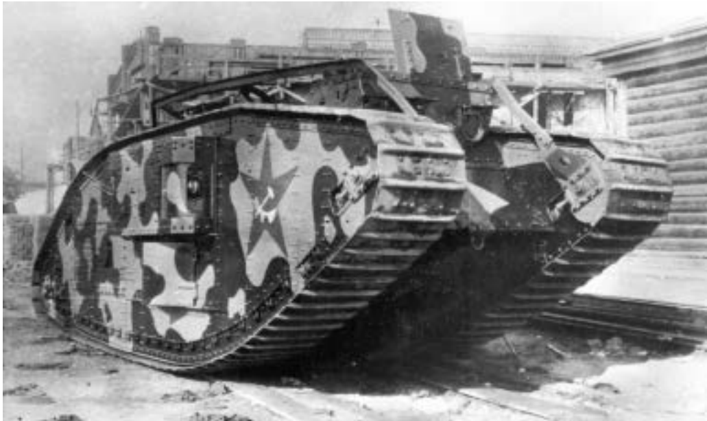
Tank Mk. V již jako „Rikardo“ v rukách Rudé armády

Kuriózní byl osud desítky Renaultů FT dovezených z USA v březnu 1920 do Vladivostoku, odkud je ukryté v uzavřených vagonch železničáři propašovali do Blagověščenska k rudým partyzánům. V červnu z nich byl postaven 1. Amurský těžký tankový divizion, který se pak až do konce roku 1921 účastnil několika akcí proti „bílým“ vojskům, přičemž osm vozů bylo v prosinci posláno na západ Ruska k opravě a poslední pojízdný 11. února 1922 zničili „bílé“ dělostřelbou z obrněného vlaku.