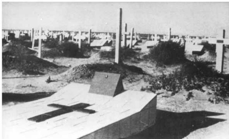
Československé hroby na vojenském hřbitově v Tobruku