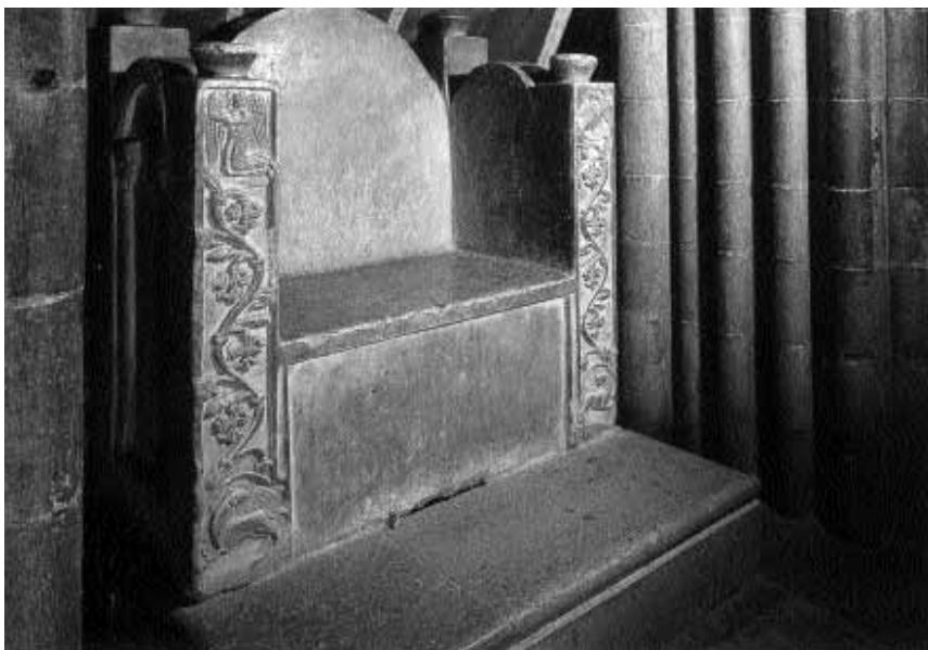
Tzv. trůn Karla Velikého v katedrále v Gironě (Katalánsko)

po roce 1000 jenom v Itálii a Galii, jak si všimá burgundský kronikář Raoul Glaber z clunyjského okruhu, ale má paralely v dalších oblastech Evropy, i když s velmi rozdílnou hustotou těchto staveb a sociální vyzrálostí jejich zakladatelů. Proto je možno hovořit o kulturním evropském obratu 11. století, které bylo zaměřeno na obdobné cíle.