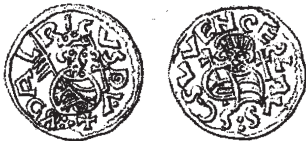
Denár knížete Oldřicha s postavou svatého Václava na reversní straně

Zajímavý je pro nás mimochodem i špatný konec knížete Svjatospolka: rozestoupivší se země pozře jej mezi „Čjachy i Ljachy“ (Povest vremennych let). „Lechové“ je označením Poláků, ale v daném citátu se podle