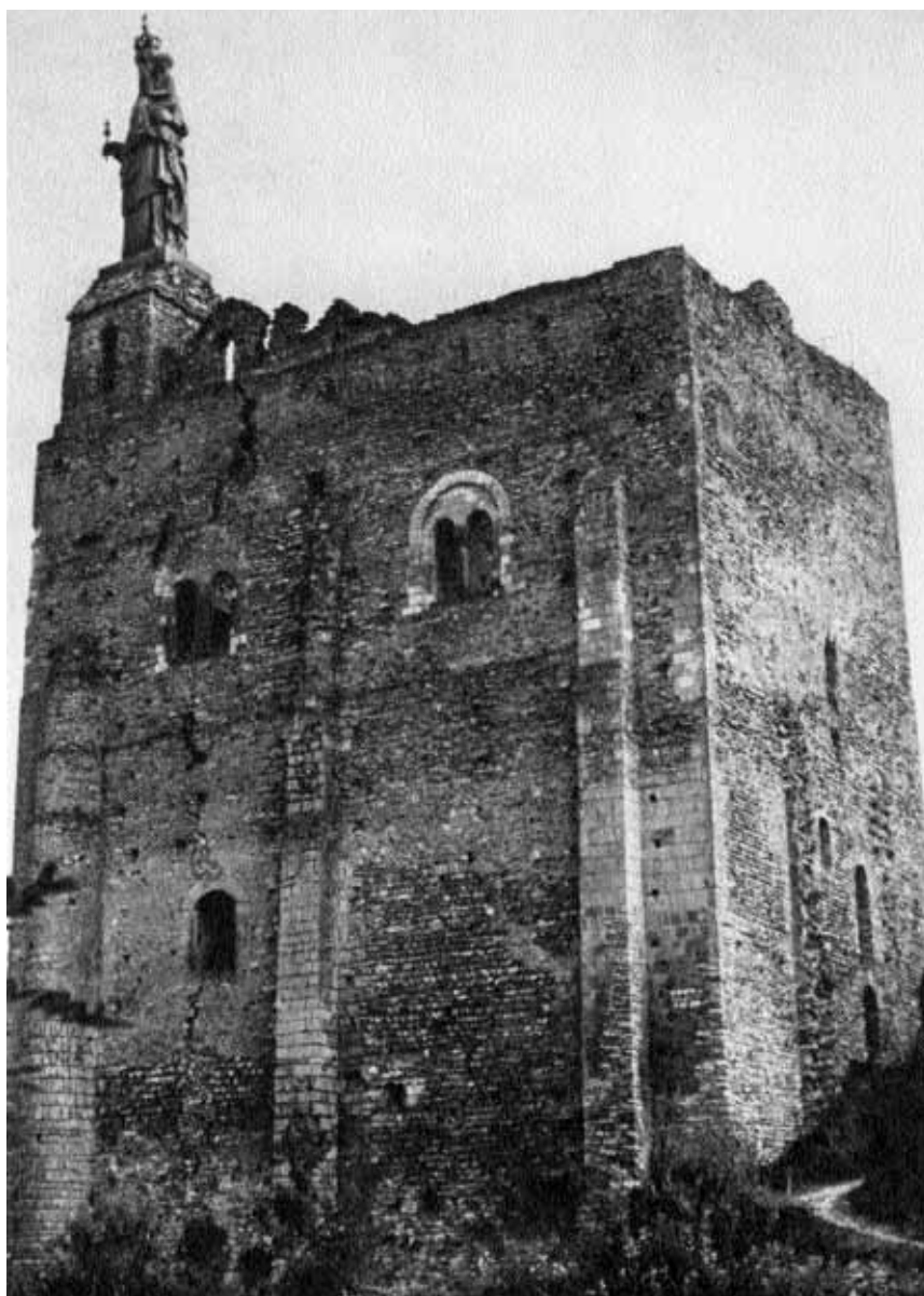
Donjon Montbazouin v Anjou přechodného typu s opěrnými pilíři (11. století)