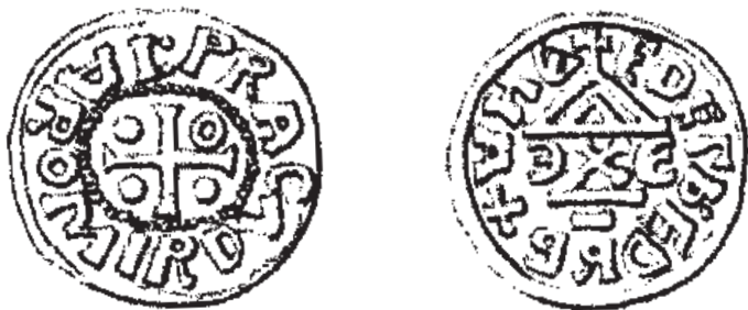
Jeden z typů denárů knížete Jaromíra – na aversu uveden český kníže a Praha jako sídlo mincovny, na reversu jméno anglosaského krále Ethelreda II.

Ke komoditám světového obchodu patřil ve starších dobách velmi cenný obchod s otroky, na němž se podílely Čechy, ale situace se proměňuje ve prospěch nárůstu specializované řemeslné a zemědělské produkce. Počet obyvatel Evropy se v průběhu 11. století zvýšil (podle některých odhadů na