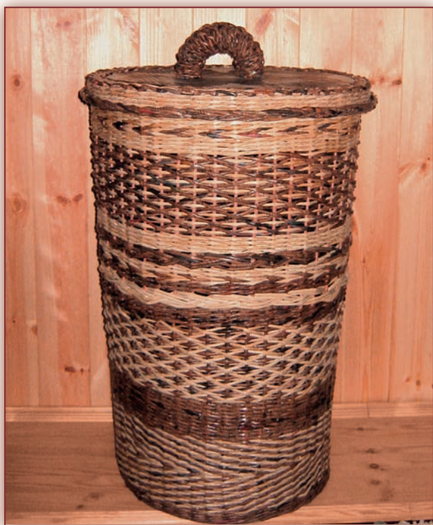
Velký koš na prádlo