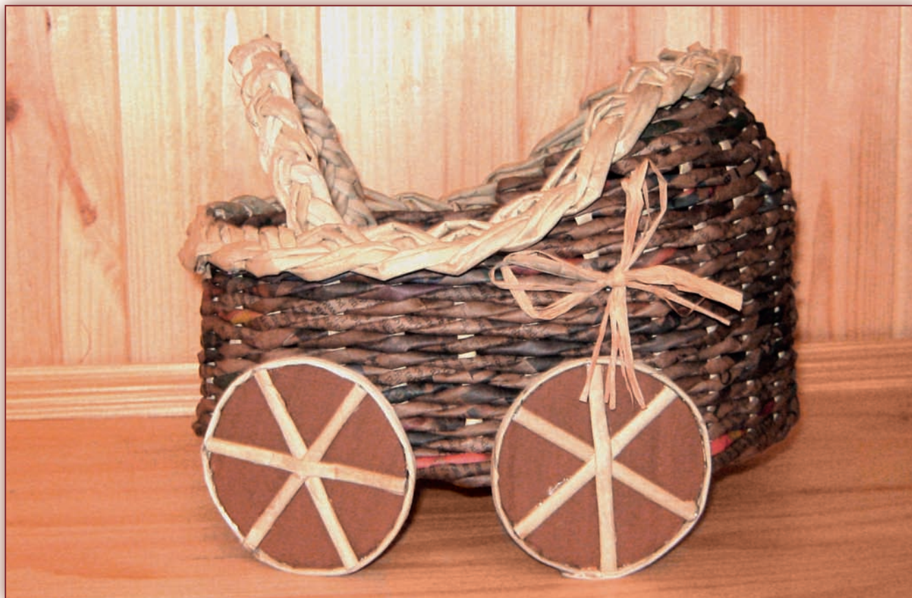
Dekorace – kočárek

Jakmile si lépe osvojíte techniku, určitě se pustíte i do takových věcí, jako je dekorační kočárek nebo velký koš na prádlo.