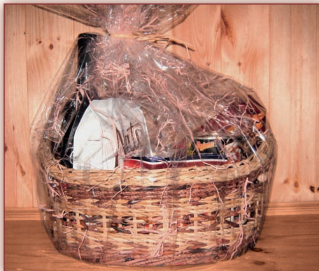
Dárkový koš k narozeninám

Pletení košíků z papíru může při troše trpělivosti zvládnout každý, a pokud jste zdělili po rodičích alespoň špetku talentu na ruční práce tak jako já, máte vyhráno! Můj tatínek umí nejen krásně malovat, ale dokáže z kousku dřeva vykouzlit nádherný přívěšek nebo dokonce plastiku, a maminka zase pod jehlou šicího stroje promění kus látky v jakékoliv šaty, ať už večerní či svatební, anebo dokonce v kyjovský kroj. Tak jako moji rodiče i já se snažím dělat svými dílky radost okolí a velice ráda se s vámi o moje zkušenosti podělím.