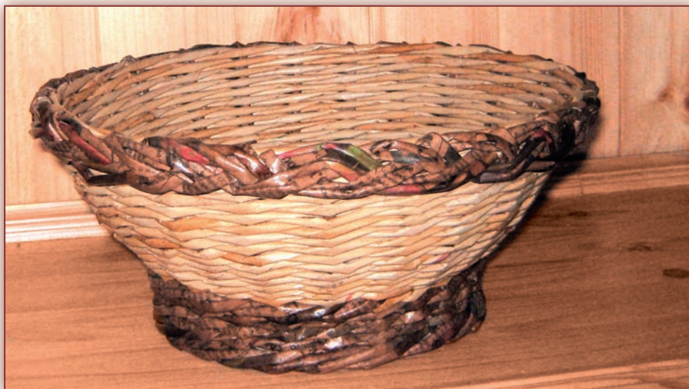
Miska na ovoce