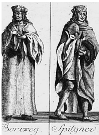
Václav Hájek z Libočan (?–1553): Bořivoj a Spytihněv (Kronika česká)