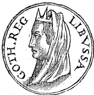
Fiktivní portrét kněžny Libuše v Promptuarii Iconum Insigniorum z roku 1553

mytickou paměti prvního historicky doloženého vládnoucího panovnického rodu v Čechách, tedy Přemyslovců, jejichž dynastie se v čele českého státu prokazatelně udržela více než čtyři století. Pokud bychom chtěli zohlednit i dobu vlád Libušiných a Přemyslových nástupců, museli bychom přičíst sto až sto padesát let s knížaty Nezamyslem, Mnatou, Vojenem, Vnislavem, Křesomyslem, Neklanem a Hostivitem, jejichž výčet uvedl děkan pražské kapituly Kosmas v latinsky psané kronice Chronica Boemorum (psána v letech 1119–1125), nejstarším spisu k českým dějinám; historicky však nejsou doloženi.