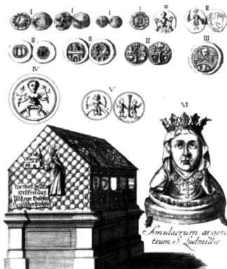
Václav Hájek z Libočan (?–1553): Relikviář sv. Ludmily (Kronika česká)

V té době totiž Svatopluk ovládl značnou část české kotliny a vybral si Bořivoje jako svého „místodržitele“. Při výběru jistě přihlížel i k tomu, že Bořivoj ovládal strategicky cenné