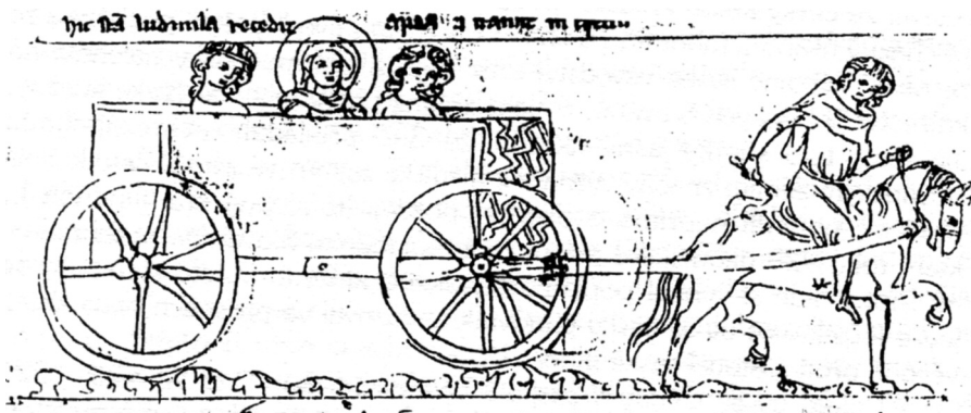
Odjezd kněžny Ludmily z Prahy (Velislavova bible, čtrnáctého století)

Zda a jak se s touto správou Moravanů českého knížectví vyrovnalo české obyvatelstvo, není jasné, ale vzhledem k Stroj mírovu povstání proti Bořivojovi, se to asi neobešlo bez problémů. Svatoplukova smrt však všechno změnila.